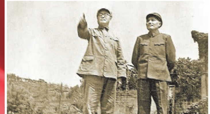
1949年，劉伯承（左）、鄧小平親臨渡江戰役前沿，部署渡江作戰。