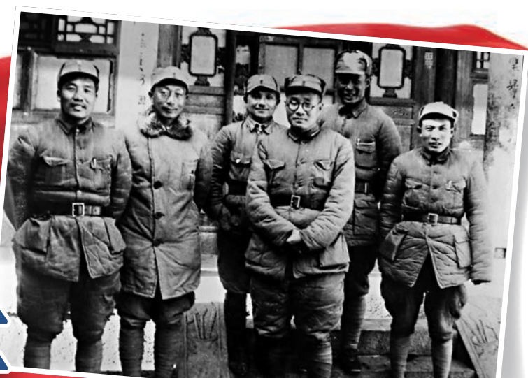
1940年初，一二九師和晉察冀軍區主要領導在河北涉縣（左起：李達、聶榮臻、鄧小平、劉伯承、呂正操、蔡樹藩）。