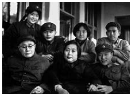
劉伯承元帥全家福。

歲月滌蕩，劉蒙憶起父親的一生好似一個「寶藏故事庫」，與人細說三天三夜也講不完。他希望用八幅書法作品，來書寫紅軍長征途中父親一路過關斬將的偉績。「事實上，從書法的角度來看，父親的字也極為漂亮。」僅從重慶解放紀念碑的碑文，以及《淮海戰役中雙堆集殲滅戰初步總結》的報告來