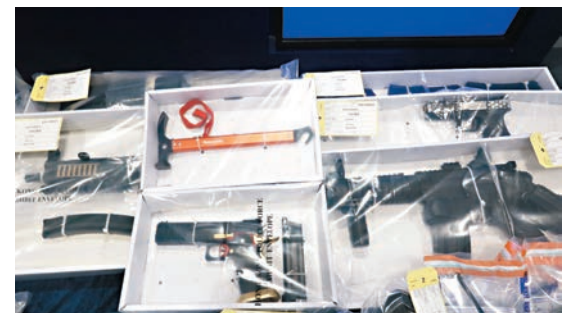
▲警方當日破案時檢獲大批槍支。 資料圖片