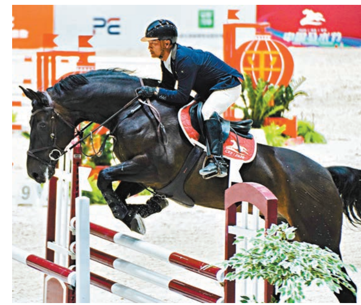
▲全紅嬋為國家隊今屆最年輕運動員。