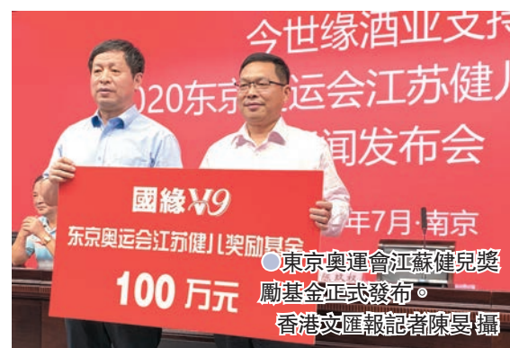
●東京奧運會江蘇健兒獎勵基金正式發布。

發布會上，「2020東京奧運會江蘇健兒獎勵基金」正式發布。據介紹，該基金由江蘇今世緣酒業股份有限公司向省發展體育基金會捐贈100萬元設立，專項用於獎勵在東京奧運會奪得金牌及獎牌的江蘇健兒，以激勵江蘇運動員在賽場上奮勇拚搏、再創佳績，為國爭光、為省添彩。