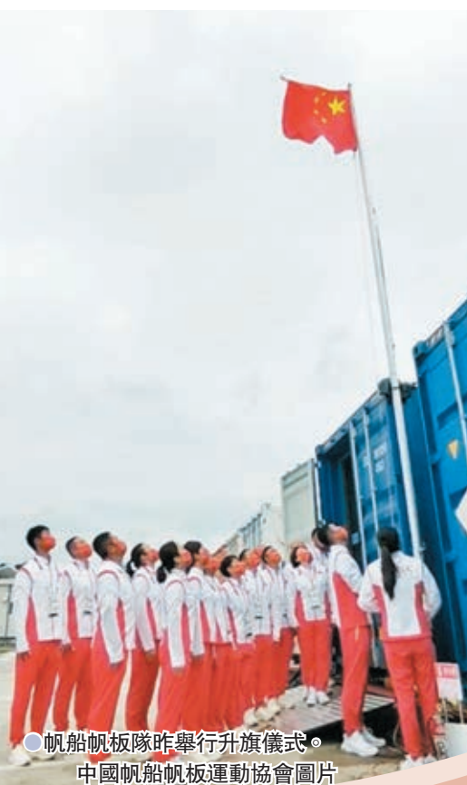
●帆船帆板隊昨舉行升旗儀式。

據中國帆船帆板協會消息，14日早晨，中國帆船帆板隊在東京江之島碼頭舉行升旗儀式，全隊將470級帆船的桅杆作為旗杆，升起五星紅旗，奏唱國歌。中國帆船帆板隊是中國代表團第一支出征的運動隊，在女子帆板項目上有衝擊金牌的機會。