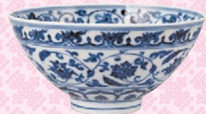
●明宣德青花纏枝花卉藏文題詩盤