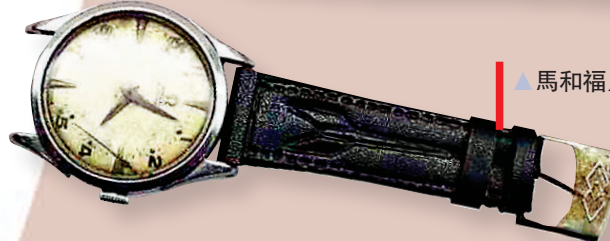
▲馬和福用過的手錶。