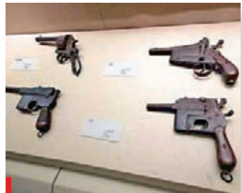
●西征紅軍用過的手槍。