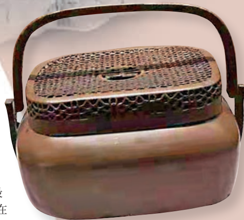
●毛澤民用過的銅手爐。