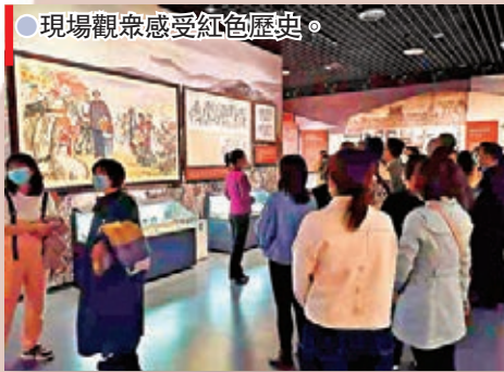
●現場觀眾感受紅色歷史。