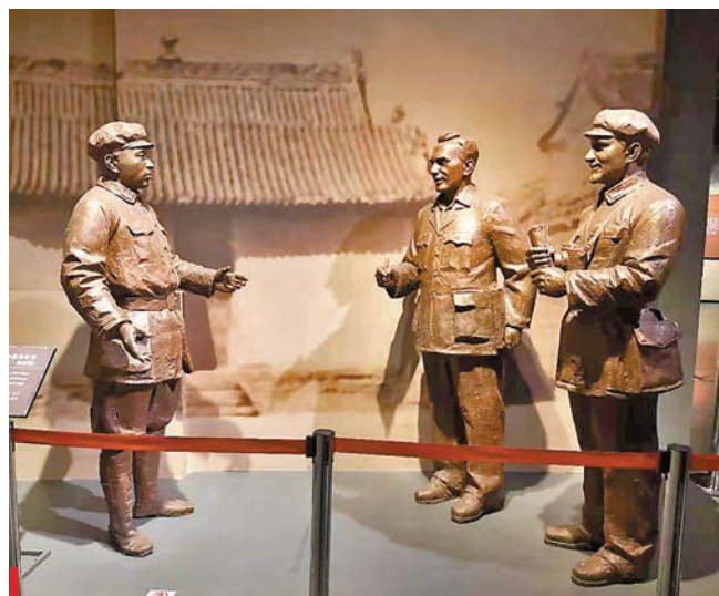
●彭德懷（左）接見斯諾與馬海德場景塑像。

據寧夏博物館講解員杜薇介紹，用故事講人物、用人物講黨史、用黨史講黨性是此次展覽的宗旨。她介紹說，寧夏博物館成立後，陝甘寧邊區回漢支隊政委梁大均將毛澤民使用過的珍貴的銅手爐捐贈給寧夏博物館，如今，陳列在寧夏博物館的這件銅手爐已成為國家一級文物，向人們「訴說」着毛澤民在鹽池的戰鬥歲月。