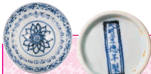
●明宣德青花纏枝花卉藏文題詩盤內部