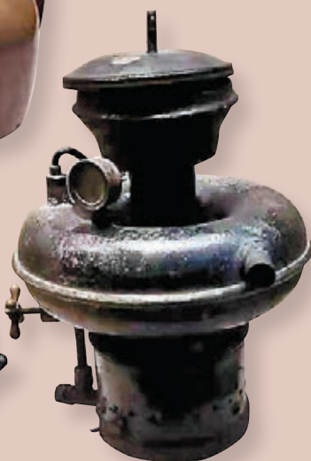
▲西征紅軍在寧夏用過的汽燈。