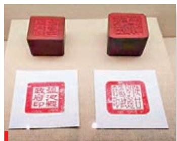
●陝甘寧邊區鹽池縣政府印章。