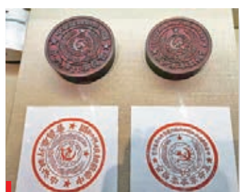
●中華蘇維埃共和國中央執行委員會印章。