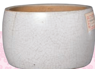
●明宣德仿汝窯蟋蟀罐

宣德皇帝有不少雅好，尤其著迷於鬥蟋蟀，為此他下令燒造了許多蟋蟀罐。然而，在清宮舊藏宣德官窯瓷器中，蟋蟀罐卻十分罕見，北京故宮也僅有一件「大明宣德年製」款仿汝釉蟋蟀罐。原來，在宣德帝去世後，為防止明英宗朱祁鎮玩物喪志，太皇太后發布命令將宮中一切玩好之物、不急之務悉皆罷去。