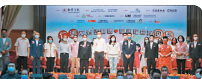
●仁濟醫院主辦「仁濟安老送關懷·愛心福袋賀回歸」活動，在國歌聲中拉開序幕。

香港文匯報訊（記者 子京）行政會議成員及安老事務委員會主席林正財昨日出席一個公開活動後表示，本港長者接種率偏低，認為適合接種流感疫苗的長者同樣適合接種新冠疫苗，呼籲長者盡快接種。