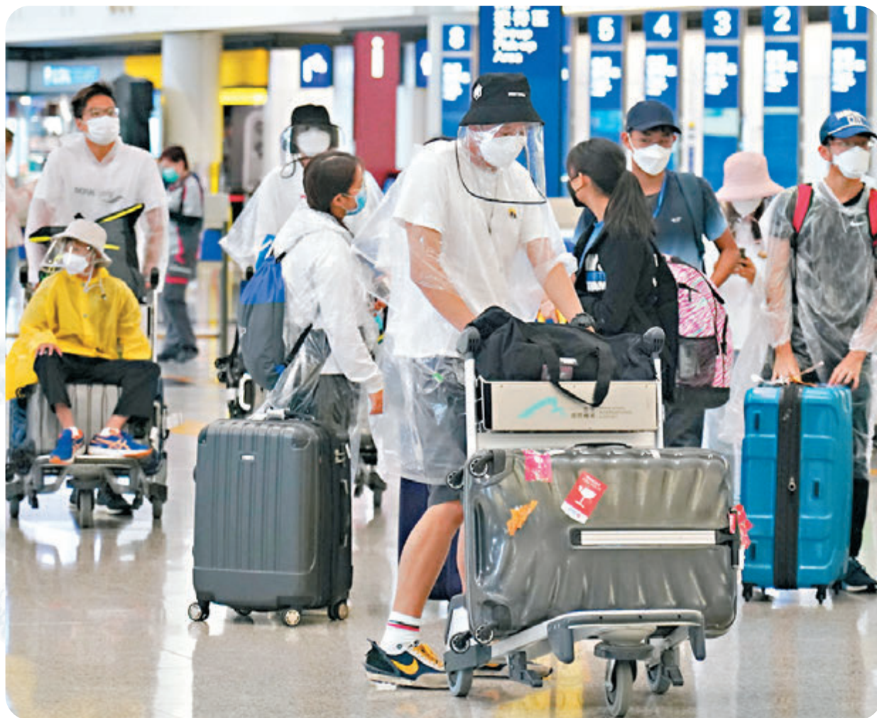
●香港特區政府擬對已打齊兩劑新冠疫苗的本港居民，放寬入境檢疫安排，從中高風險地區返港的檢疫期縮至7天，極高或甚高風險地區返港的檢疫期則為21天。有專家擔心將引發第五波疫情。圖為早前大批英國留學生搭乘航班飛抵香港。