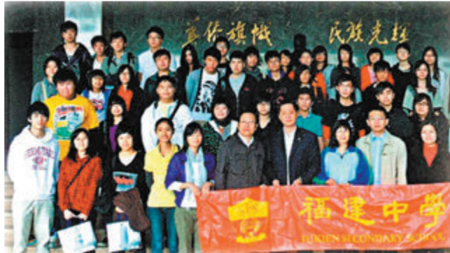
●福建中學師生到福建華僑大學實地考察。