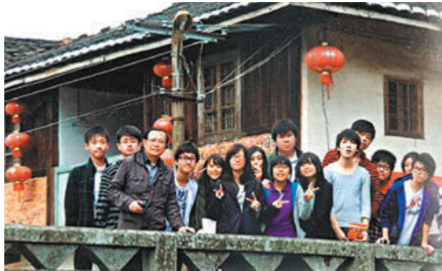
●福建中學師生一同遊覽福建塔下村。