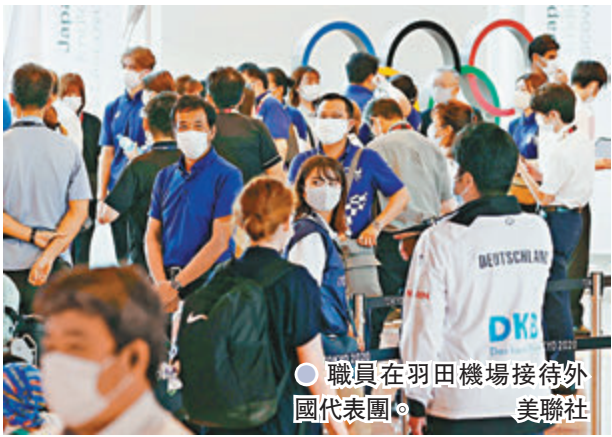
●職員在羽田機場接待外國代表團。