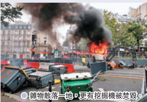
●雜物散落一地，更有挖掘機被焚毀。