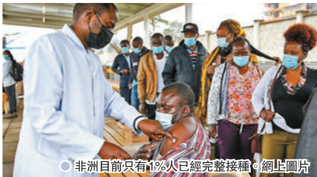
●非洲目前只有1%人已經完整接種。

傳染力更強的Delta新冠變種病毒擴散全球，即使在疫苗接種率較高的美國、英國、以色列等地，社會同樣擔心未能如期走出疫情；不過若對比全球各地數據，便可發現即使同樣是Delta蔓延，接種率高與接種率低的國家之間，疫情發展出現明顯分別，或可讓Delta尚未肆虐的地區借鑑。近期一項針對美國一個健身室群組進行的研究，發現47名感染Delta變種的患者中，僅4人已打完兩針，3人則只接種一劑，加州大學柏克萊分校電腦基因學家懷曼認為，情況反映若人口中仍有人未打針，疫苗也難以完整發揮效力，正正是Delta令人擔憂之處。