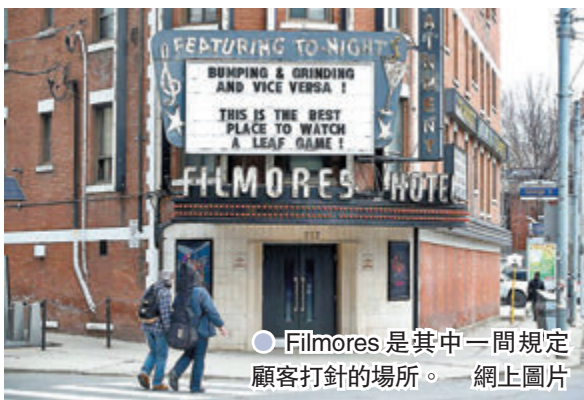
●Filmore's是其中一間規定顧客打針的場所。

香港文匯報訊（特約記者 成小智 多倫多報導）加拿大人口最多的安大略省周五啟動重開經濟第3階段，省內脫衣舞俱樂部獲准重新開門營業，為了保障員工及顧客的安全，不少脫衣舞俱樂部表明要求所有客人提供接種新冠疫苗證明文件。