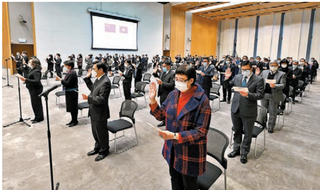
李家超表示，擁護基本法、效忠香港特區是候選人的基本要求和條件。圖為香港政府在政府總部舉行公務員宣誓儀式。