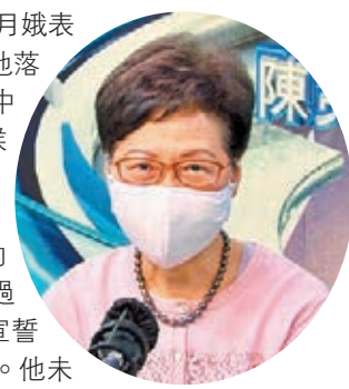
林鄭月娥 網站圖片

她強調，有關宣誓要求已經寫得非常詳細，相信已經辭職的200多名區議員是自己量度過，過去一段時間的某些行為與有關宣誓的負面清單吻合才作出這個決定。他未必是純粹怕金錢損失而辭職，最終考慮應該是有沒有信心自己符合區議員宣誓「擁護基本法、效忠香港特區」的要求。