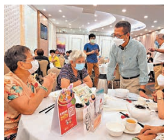
●陳茂波到香港仔飲早茶時與街坊閒話家常，也聽聽大家對消費券的意見。

他前日特意邀約飲食界張宇人議員到酒樓飲早茶，不少茶客高興地分享他們已登記了消費券，