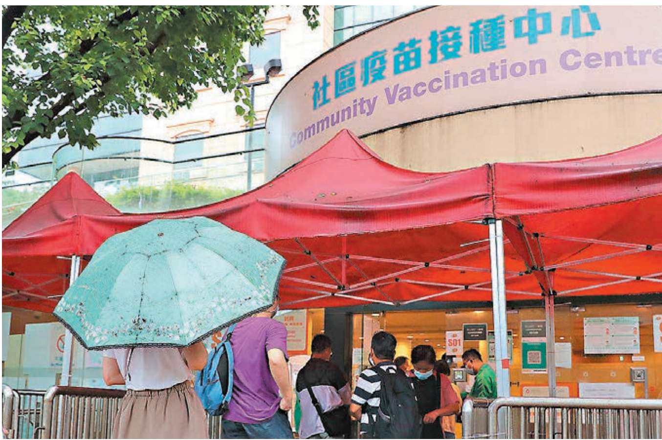
●昨日有雨，香港中央圖書館科興疫苗接種中心到場市民依然絡繹不絕。