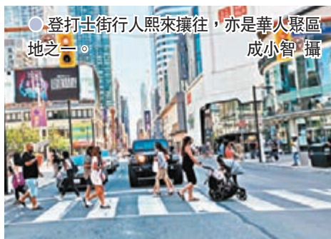
●登打士街行人熙來攘往，亦是華人聚居之地。

多倫多市長莊德利表示：「登打士從未去過多倫多，我們不應該標榜與現今價值觀不同的人。」市政府將會設立一個社區諮詢