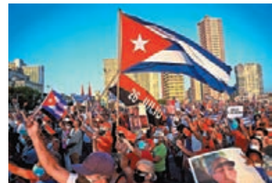
●古巴政府支持者揮舞國旗。