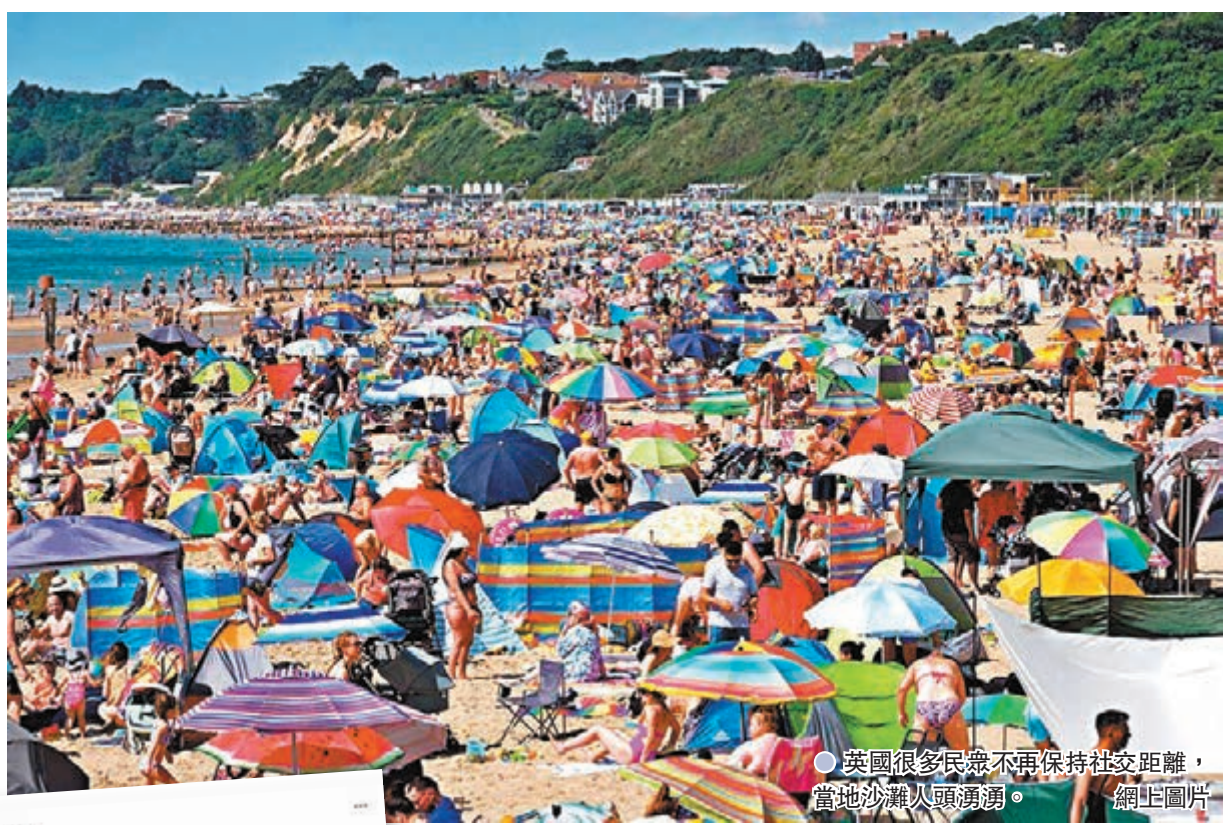
●英國很多民眾不再保持社交距離，當地沙灘人頭湧湧。

新冠肺炎Delta變種病毒肆虐，英國近期疫情惡化，前日新增54,674宗確診，創下半年來新高。然而英國政府今日如期解封，解除英格蘭地區絕大部分防疫措施，口罩令、限聚令和社交距離限制統統撤銷。專家指出目前英國確診個案不斷上升，首相約翰遜堅持解封，明顯是另一場「豪賭」，極可能大幅推升住院和死亡病例，加劇醫療系統壓力，屆時可能被迫重新封城，國民對政府更不信任，令約翰遜民望再受打擊。