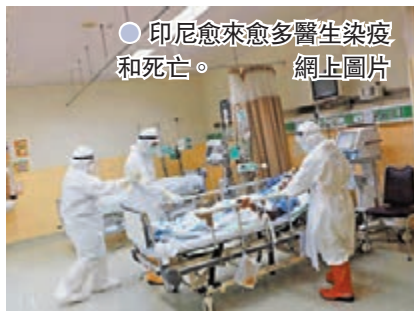
●印尼愈來愈多醫生染疫和死亡。

東南亞多國新冠疫情持續惡化，在疫情最嚴峻的印尼，當地醫生協會指出，本月截至前日的17天內，已有114名醫生疫歿，是相同日數內醫生疫歿人數最高紀錄。協會擔心現時醫療系統已瀕臨崩潰，愈來愈多醫生染疫和死亡，醫院的醫護人手將進一步短缺。