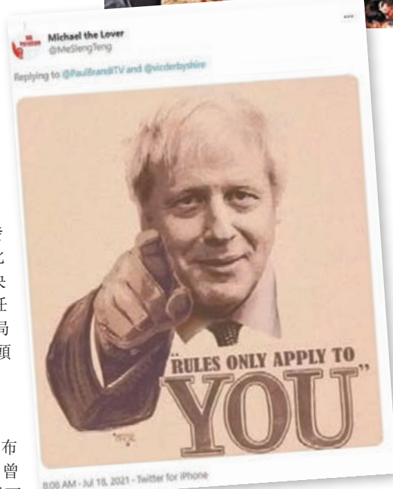
●網民「惡搞圖」批評約翰遜享有特權。網上圖片