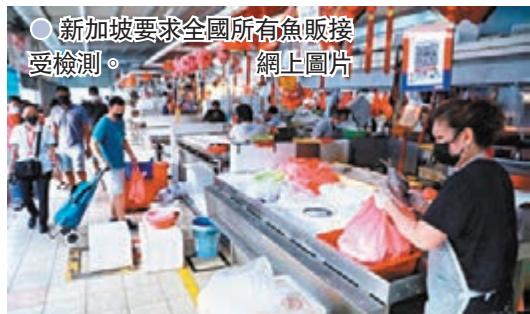
●新加坡要求全國所有魚販接受檢測。網上圖片

新加坡近日爆發群組感染，昨日新增88宗本地個案，是11個月以來最高，其中23宗屬於卡拉OK夜總會群組，該群組累計已錄得172宗個案，另有37宗屬於裕廊漁港群組，最早發現的個案來自曾到漁港取貨，再將海鮮運至各個市場出售的魚販，目前已有11個街市的魚販確診。當局昨日下午關閉全國街市的海鮮攤檔，所有魚販須接受病毒檢測。