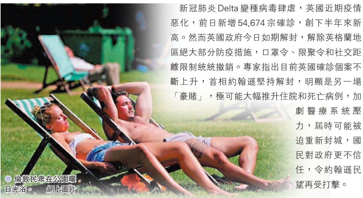
●倫敦民眾在公園曬日光浴。

新冠肺炎Delta變種病毒肆虐，英國近期疫情惡化，前日新增54,674宗確診，創下半年來新高。然而英國政府今日如期解封，解除英格蘭地區絕大部分防疫措施，口罩令、限聚令和社交距離限制統統撤銷。專家指出目前英國確診個案不斷上升，首相約翰遜堅持解封，明顯是另一場「豪賭」，極可能大幅推升住院和死亡病例，加劇醫療系統壓力，屆時可能被迫重新封城，國民對政府更不信任，令約翰遜民望再受打擊。