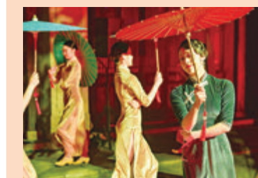
●《尋夢·坊巷》演出以「人文世遺、數字世遺、綠色世遺」為核心表達。

福州派江吻海,自古以來就是海上絲綢之路的重要發祥地和重要樞紐城市,在長期對外經貿文化交流中,福州留下了豐富的歷史文獻、文物史跡和考古遺存。如今,海絲遺跡星羅棋布,不懼歲月的淘洗,仍舊熠熠生輝在時代的最前沿。來到福州,除品讀三坊七巷、上下杭等遺跡外,還可以尋訪福州豐富的海絲史跡遺存。在穿越閩都千年繁華、古韻海絲風情中,讓世界看見福州。