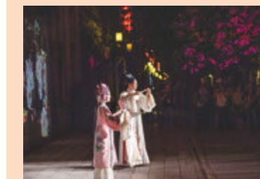
●三坊七巷沉浸式演出採用聲光電等多媒體技術,結合閩劇表演、非遺展示等手法,共分為八個篇章。