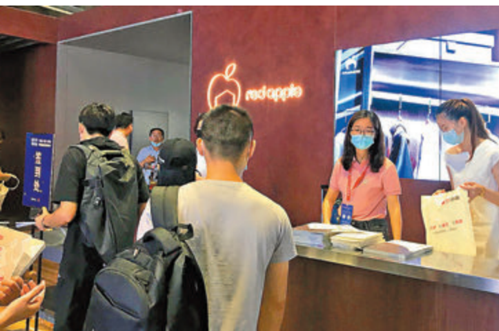
●香港品牌紅蘋果傢俱吸引大量經銷商。

本屆建博會,逆市吸引大量香港品牌參與。他們通過增加產品科技含量、拓寬線上渠道、拓展一二線乃至四五線城