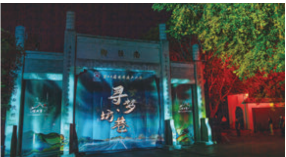
●世界遺產大會期間,一場美輪美奐的《尋夢·坊巷》沉浸式演出在三坊七巷舉行。

三坊七巷沉浸式演出採用聲光電等多媒體技術,結合閩劇表演、非遺展示等手法,共分為八個篇章,分別是「夢迴坊巷」「情滿書鄉」「盛世華章」「閩都印記」「舞韻榕情」「天地人和」「群賢畢至」和「圓夢時分」,在三坊七巷北口牌坊、風雨廊、宗陶齋、愛心樹、光祿吟台和南口等地點開展沉浸式演藝,充分調動遊客「五感」獲得深層次沉浸感,為嘉賓帶來豐富的文化內涵、感官體驗、視覺盛宴。