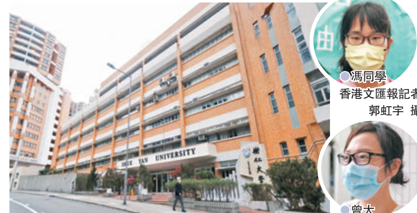
●不少考生昨日在放榜後趕赴樹仁大學報讀課程。圖為該校校舍外觀。