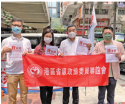
● 張玥親臨街站，身體力行支持全國人大通過完善香港選舉制度的決定。