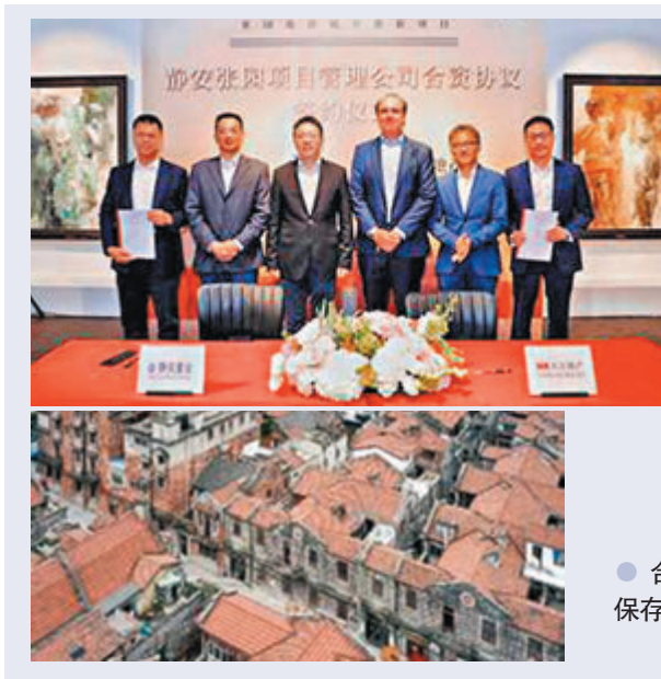
●上海市靜安區政府、上海靜安置業集團及太古地產的領導出席靜安張園項目管理公司合資協議簽約儀式。

張園的歷史悠久，商人張叔和於1882年取得張園的業權並進行擴建，使之成為一個現代的公眾聚集地。由1885年對公眾開放至二十世紀初，張園一直被視為上海最知名的文化娛樂活動場所。這裏是上海最早對市民開放的遊樂場，並成為展覽、戲劇、魔術表演、休閒活動、聚會、演講、社交和餐飲的熱門場所。