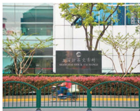
●滬綜指昨收報3,562點，漲25點。資料圖片

源達分析，從市場短期趨勢看，鋰電池板塊強勢爆發，極大程度提升了市場資金活躍度，有助進一步刺激科技成長股行情延續，創業板指短線有望延續震盪向上格局；而滬綜指在3,562點一線收盤後，後市能否放量突破該點位，將取決於權重指標藍籌股表現，這也將決定指數能否繼續向上反彈，否則滬指仍將在3,500至3,560點區間震盪。