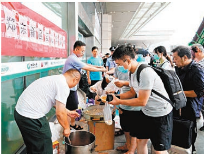
●鄭州千年一遇的大暴雨,一個個「愛心之舉」在朋友圈洗版。圖為工作人員在鄭州東站進站口處為滯留旅客提供早餐。

告訴香港文匯報記者,文檔在發出當晚就已經爆了,經過24小時的持續發酵和全網傳播後,大批求救者已經陸續得到幫助。文檔建成的第三天(22日)開始,表格裏的求救信息已經消化得差不多了,文檔的功能也需要有新定義。「我們就在群裏收集了大家的建議,呼籲不再在文檔中增加過多的新的申請和求助信息,而是開始引導大家到官方求助渠道发布信息,否則繼續發布