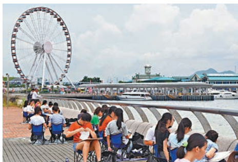
●有市民慨嘆藝術等科目通常會被稱為「揸兜」。圖為青少年在中西區海濱長廊寫生。

何漢權建議特區政府參照德國、新加坡、內地和台灣地區的模式，立下決心去做，根本性地改變評核制度，設立學術成就或多元發展的評核，「如體育、藝術方面應該由學科去適應專才，而非本末倒置。」同時，政府需要思考如何透過政策規劃，制定短中長期可以實行的行動規劃。