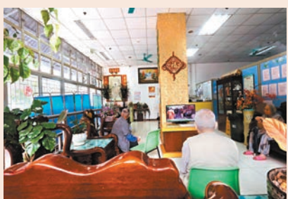
●安老院舍。資料圖片

梁志祥直言，強積金難以保障市民的退休生活，特區政府需要正視和思考訂立新的退休政策，改善現時部分長者靠政府支援僅僅糊口的狀況，建議可推出全民退休保障計劃，用公積