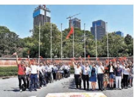
●建立港青國家意識及國際視野，對培育青年公民素養和競爭力有重大意義。圖為內地及港澳青年相聚深圳。