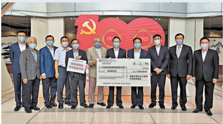
●香港中華出入口商會捐款200萬港元支援河南災區，中聯辦副主任譚鐵牛(右五)代表接受捐款。

商界向來是香港強大的慈善力量之一，看到河南同胞受水災所困，不同企業及商界團體都慷慨解囊，冀為河南災民提供幫助，讓他們盡快恢復正常生活。