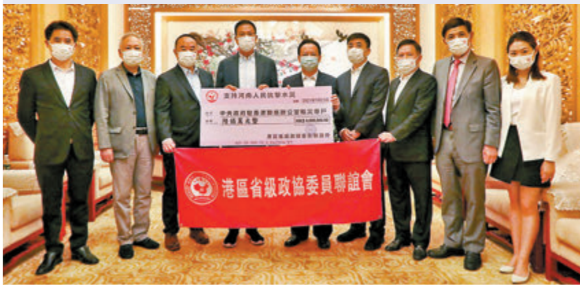
●港區省級政協委員聯誼會捐贈600萬港元賑災，中聯辦副主任譚鐵牛(右五)代表接受。