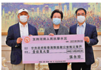
●張永珍個人捐款100萬元，中聯辦副主任仇鴻(中)代表接收。