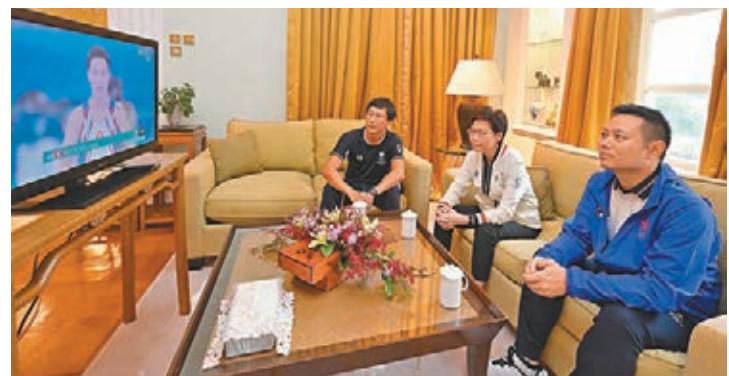
●林鄭月娥透過電視直播觀看港隊在東京奧運會的比賽。

她同時祝賀國家射擊隊選手楊倩奪金：「我亦祝賀國家隊奪得東京奧運的首面金牌——楊倩在女子10米氣步槍項目中奪金。精彩奧運節目接踵而來，大家不要錯過這體壇盛事。」