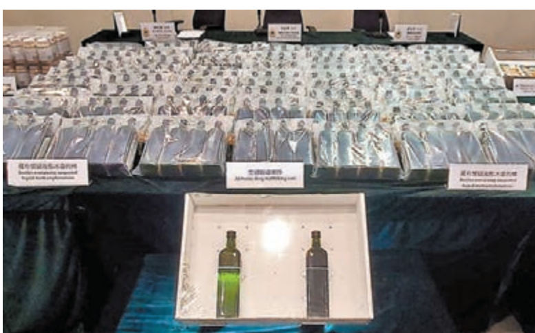
●檢獲的145公斤液態冰毒藏於牛油果食物油內，市值逾8,000萬元。

李錦榮表示，3案被捕的4男1女（31歲至64歲），當中涉牛油果食用油藏毒案被捕的60歲男子，相信與案無關，已獲釋；另涉火炭工廠保健食品藏毒案被捕的43歲男子已獲准