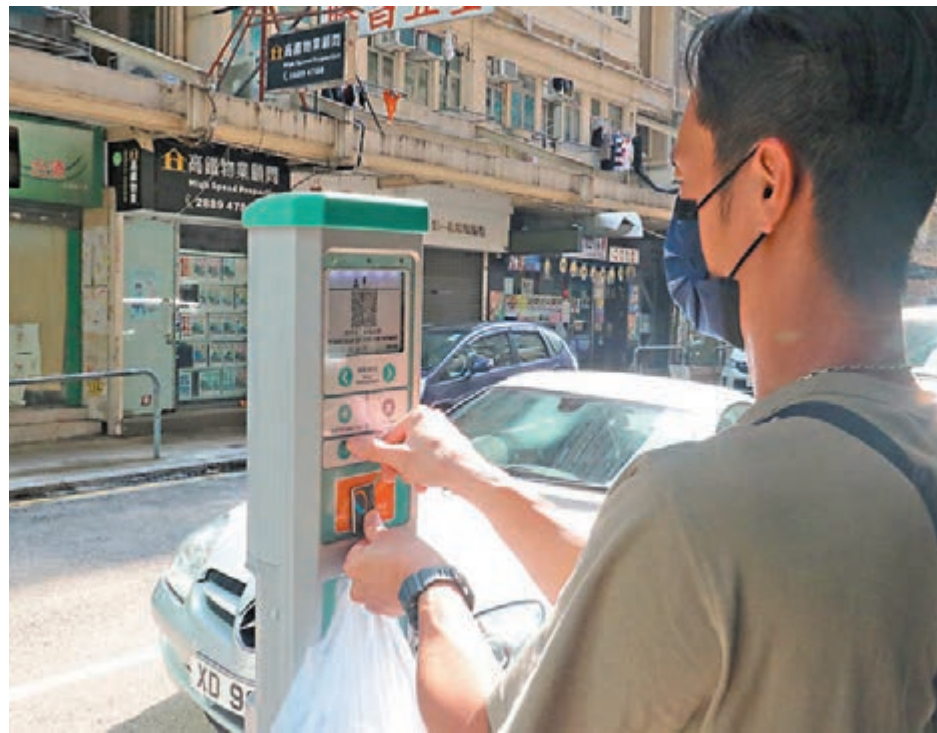
●香港文匯報記者發現小區內的咪錶車位並非想像中「一位難求」。

遭兩非法代客泊車集團長期霸佔的咪錶車位，全部位於油麻地文咸街至文匯街舊區，八座「文」字頭、俗稱「八文樓」的樓宇一帶街道。