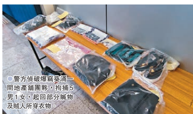
●警方偵破爆竊葵涌一間地產舖案，拘捕5男1女，起回部分贓物及賊人所穿衣物。

海關相信運港毒品總量持平，並無明顯上升，而連破大案是因為海關風險管理及運用高科技緝毒成效。