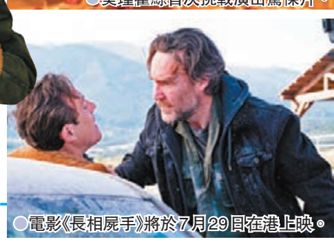
電影《長相屍手》將於7月29日在港上映。