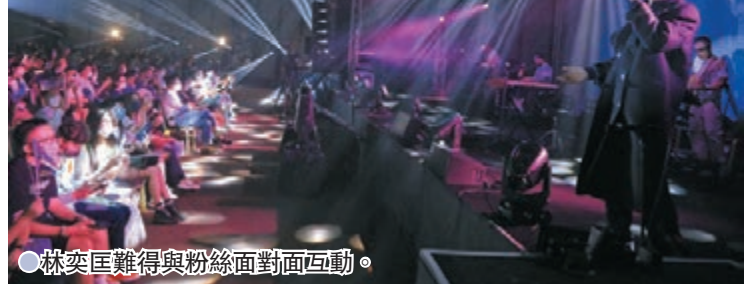
林奕匡難得與粉絲面對面互動。