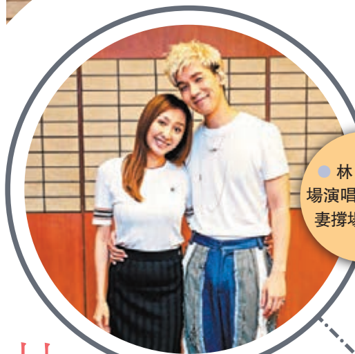
林奕匡兩場演唱會均獲愛妻撐場打氣。