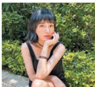
Anjaylia 沒計劃退出娛樂圈。