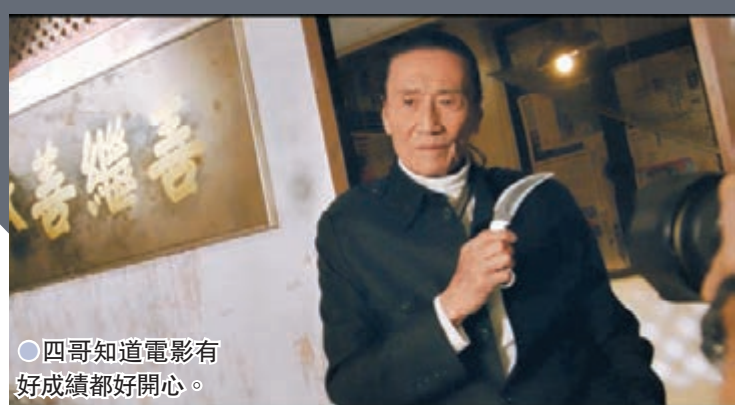
四哥知道電影有好成績都好開心。