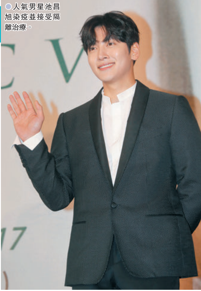
●人氣男星池昌旭染疫並接受隔離治療。