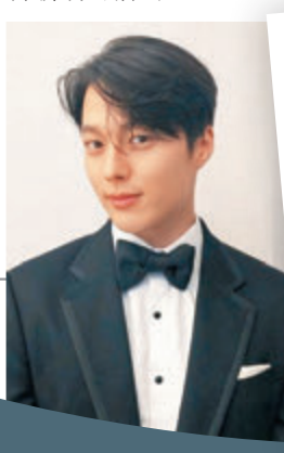
●張基龍即將低調服役。

據悉，電視劇《現正分手中》是一部浪漫愛情電視劇，張基龍與宋慧喬分別飾演男女主角，兩人將帶來甜蜜浪漫的姐弟戀，這也是今年觀眾們十分期待的一部劇。宋慧喬昨日也在社交平台分享了一張與張基龍在新劇中的黑白背影照，看起來相當甜蜜，讓粉絲們更加期待新劇的播出。