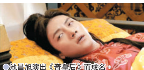
●池昌旭演出《奇皇后》而成名。