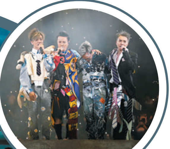
●C AllStar四子在台上顯得難捨難離。