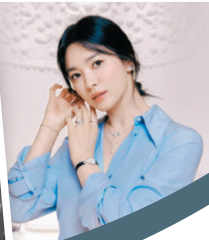
●宋慧喬上載黑白背影照。