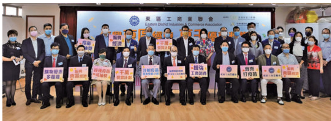
●東區工商聯推萬千優惠獎賞促經濟。