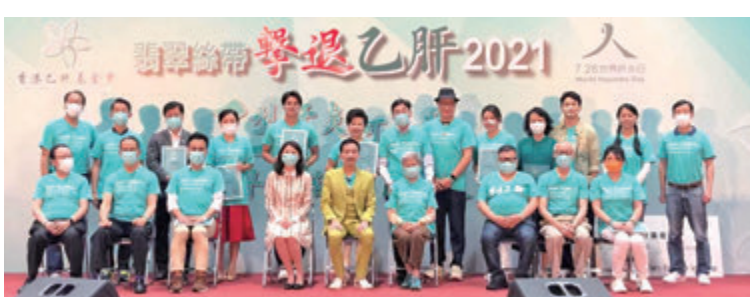
●「翡翠絲帶擊退乙肝2021」活動，賓主合照。

香港乙肝基金會每年在7月28日世界乙肝日前，都會舉辦活動以宣傳世界乙肝日的意義，及加強宣傳預防及治療乙肝的訊息。為提高市民大眾對乙型肝炎風險的認知，日前大會舉辦「翡翠絲帶擊退乙肝2021」活動。大會邀請香港食物及衛生局局長陳肇始及香港乙肝基金會會長黎青龍，頒授香港乙肝基金會委任狀予各乙肝基金會顧問；同時委任2021年乙肝大使，並邀請多位專家及醫生，齊向市民講解肝炎的預防及治療訊息。大會亦安排表演嘉賓，藉音樂和娛樂發放正能量。