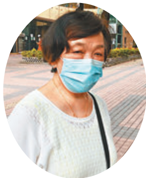
►洪女士認為新安排可以方便不懂得上網的長者。