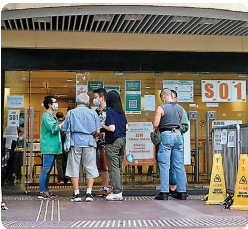
●特區政府明日開始在其中24間接種中心向70歲或以上長者派發「即日籌」。圖為中央圖書館疫苗接種中心。