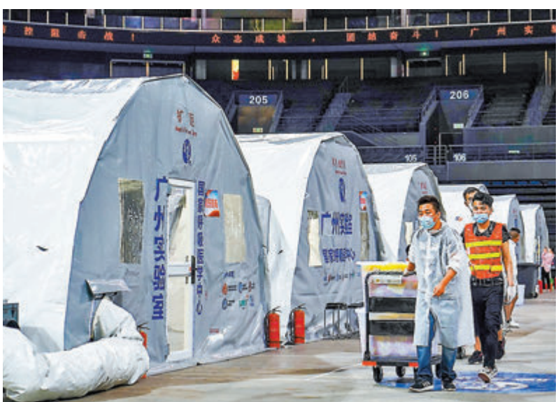
● 南京疫情蔓延至5省8市。曾在廣州全員核酸檢測中發揮重要作用的「獵鷹號」氣膜實驗室運抵南京青奧體育公園體育館。圖為27日,工作人員在搬運氣膜實驗室所需物品。

此外,南京市還要求非必要不開展大型線下活動,倡導喜事緩辦,喪事簡辦,並減少聚餐,實行分餐制,暫停KTV、電影院等密閉場所營業,暫停培訓機構(含託管)線下服務。