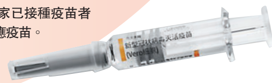
整理:香港文匯報記者 劉凝哲

世界衛生組織表示,目前沒有足夠證據表明需要接種第三劑疫苗。美國輝瑞等製藥公司應專注於為沒有機會獲得第一劑疫苗的國家提供疫苗,而不是為富裕國家已接種疫苗者打加強針供應疫苗。