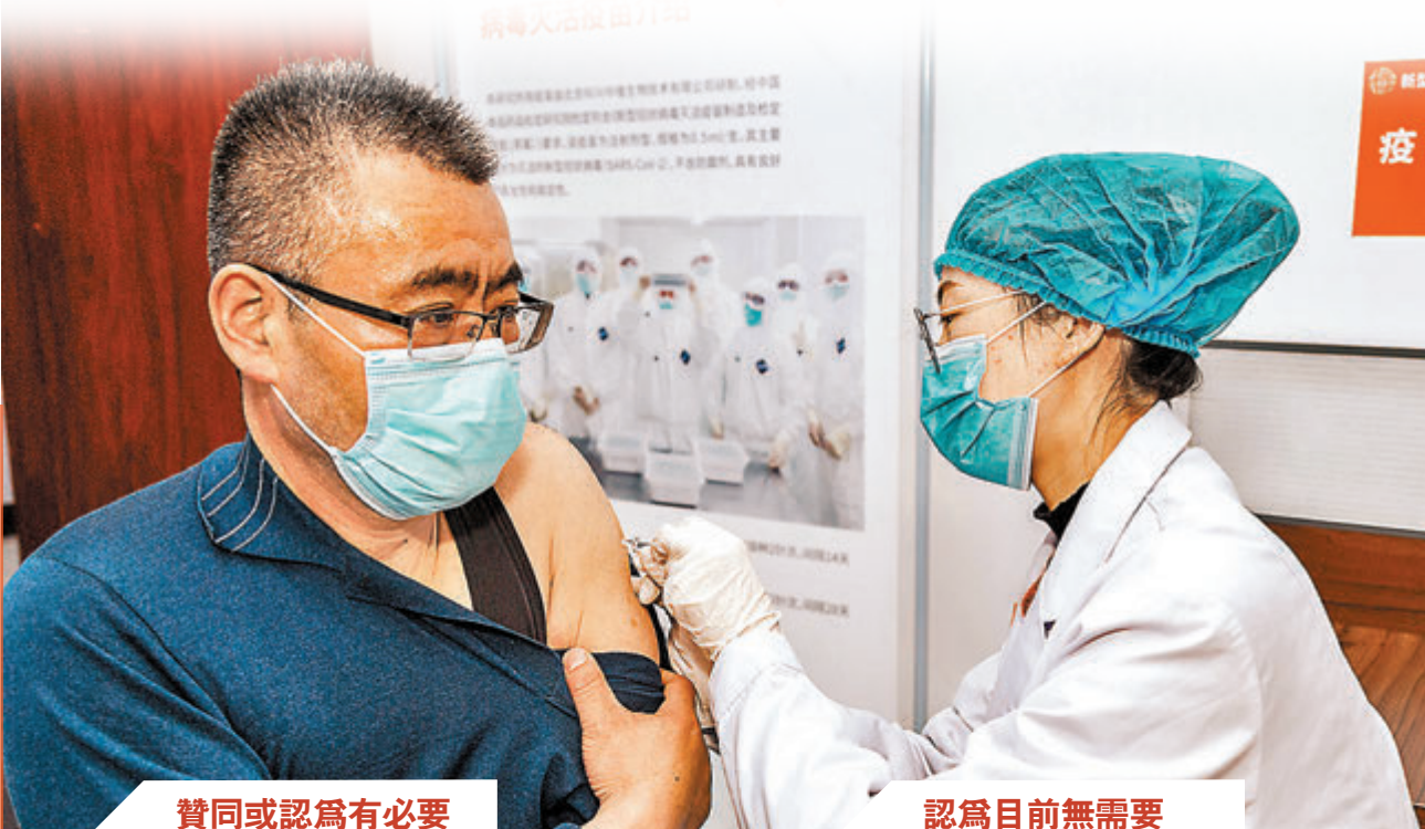
贊同或認為有必要