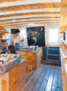
●西島隨處可見的仙人掌。