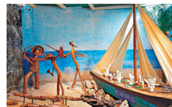
●西島文創館裏用廢棄物製作的作品。

從2018年開始，三亞市天涯區提出了建設「無塑生態西島」的目標，此後不斷投入資金，引入技術和人才服務，開啟生態島建設探索，力爭把西島打造成「無廢」旅遊文化示範區。西島文創聯合波蘭、加拿大、韓國環保藝術家、美國材料科學家等，利用回收舊物創作系列作品，以生態可持續利用為目標，引導人們更加重視生態島嶼共建意識。西島村民還共同制定了「生態十年之約」以實現「生態島」的夢想。