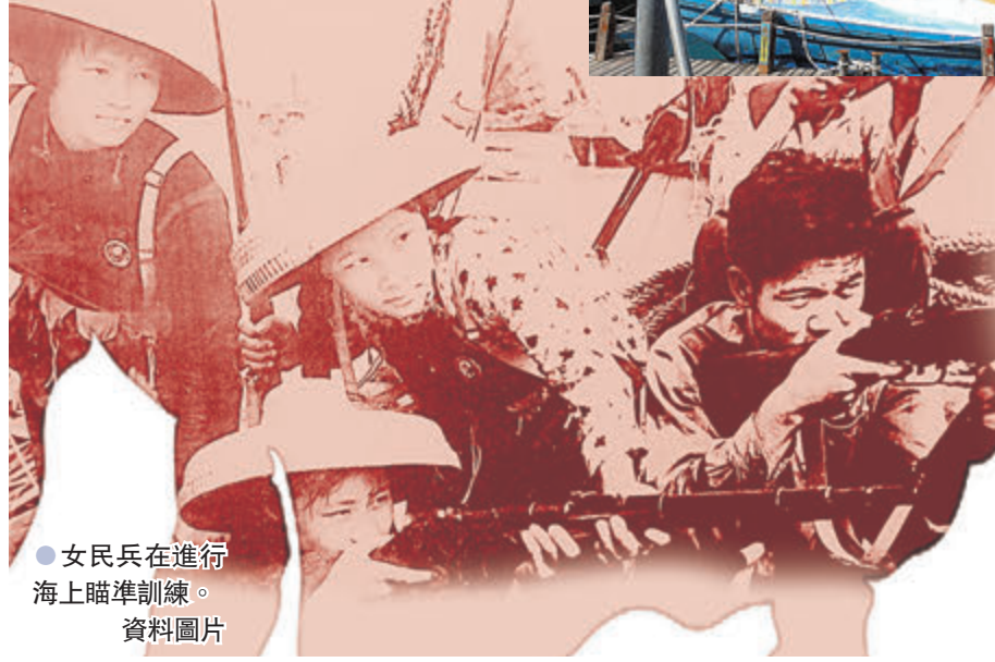
●女民兵在進行海上瞄準訓練。