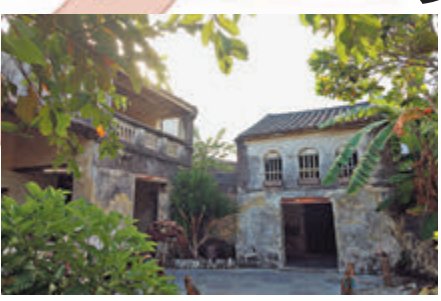
●珊瑚石堆砌的老房子。