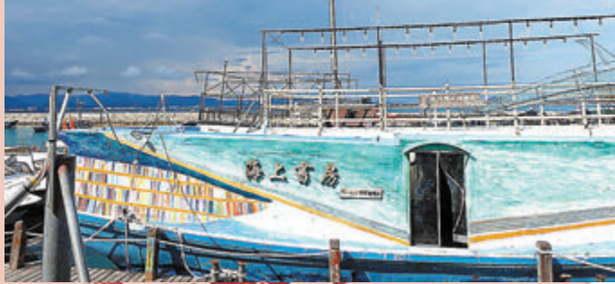
●海上娛樂項目吸引遊客。