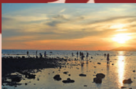
●夕陽西下海邊「趕海」的遊客。