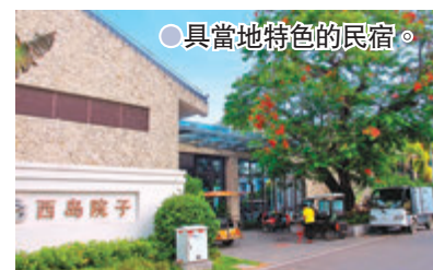
●具當地特色的民宿。

的家居布置，十分受遊客歡迎，住進這樣的珊瑚老屋中，晚上在小院裏滿天星下，靜靜感受滄海桑田的變遷，讓許多人嚮往。「西島院子」則是配套設施完善的輕奢型海島民宿，院子的設計回歸悠然自得的海島生活，將風情濃郁的海島元素融入，保持了輕奢典雅的格調，引得不少小資慕名前往，感受珊瑚牆、老房子、青藤和鮮花造就的意境。