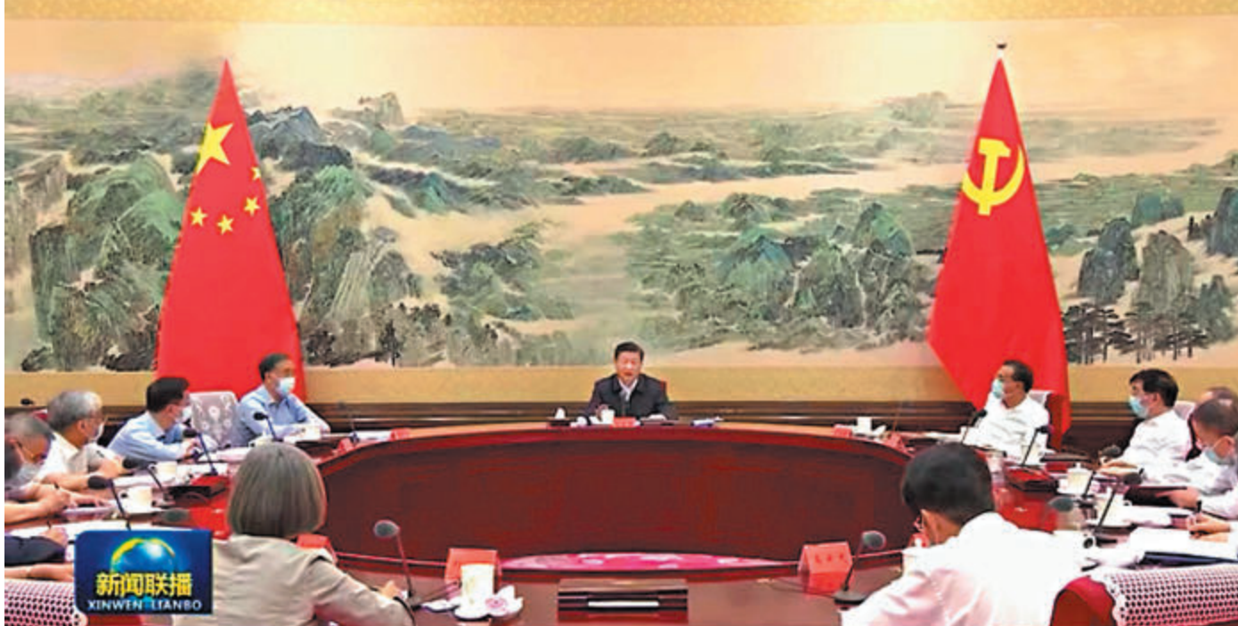
●7月28日，中共中央在中南海召開黨外人士座談會，就當前經濟形勢和下半年經濟工作聽取各民主黨派中央、全國工商聯負責人及無黨派人士代表的意見和建議。

香港文匯報訊 據新華社報道，中共中央政治局7月30日召開會議，分析研究當前經濟形勢，部署下半年經濟工作。中共中央總書記習近平主持會議。