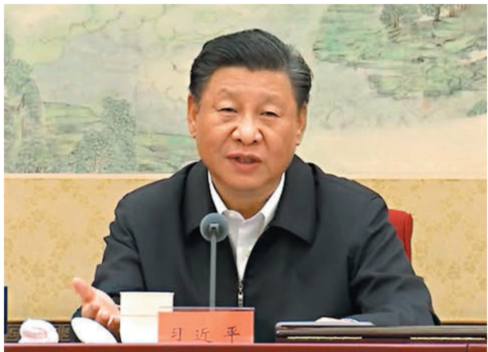
●7月28日，中共中央在中南海召開黨外人士座談會，中共中央總書記習近平主持座談會並發表重要講話。