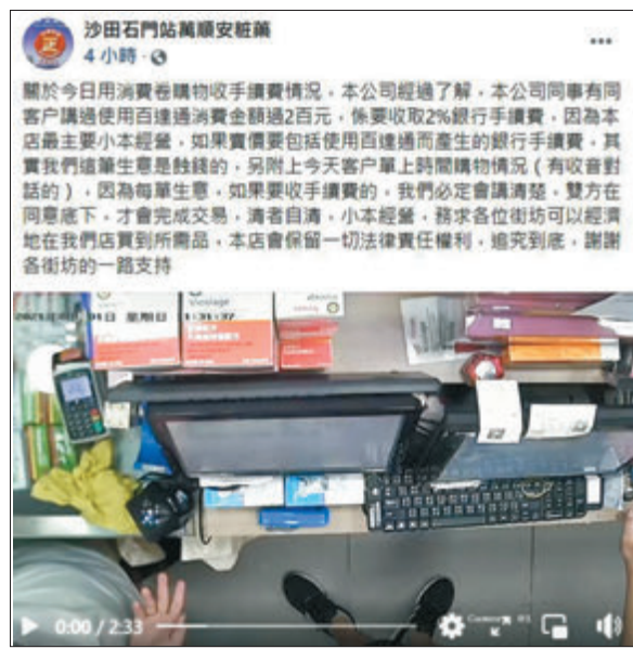
●「萬順安藥業」在公司fb專頁上載閉路電視片段。圖為「萬順安藥業」fb截圖

香港文匯報訊（記者 黃恆諾）政府昨日開始向市民派發首期電子消費券，但亦同時出現消費券購物陷阱。有網民上載在沙田一間藥房的購物單據，投訴以八達通付款時被收取手續費。八達通發言人回覆香港文匯報查詢時表示，他們與商戶簽署的開戶協議有規定，商戶不能向顧客收取貨品實際價錢以外的額外費用。