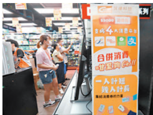
●不少商戶參與消費券計劃，並在店內貼出告示歡迎市民使用消費券消費。

香港文匯報訊（記者 邵昕、黃恆諾）首期消費券昨日發放，適逢周日大量市民興沖沖趕往消費，帶旺大小店舖生意。不少商戶接受香港文匯報訪問時都看好消費券計劃，期望藉此彌補疫情下的損失。有電子用品店生意明顯提升，昨日九成生意以消費券支付，亦有服裝店兩小時開4張單。不過，也有小商戶指不少市民都等消費券派發後才消費，反而令他們6月至7月生意額下跌，期望消費券派發後可帶動生意額上升。