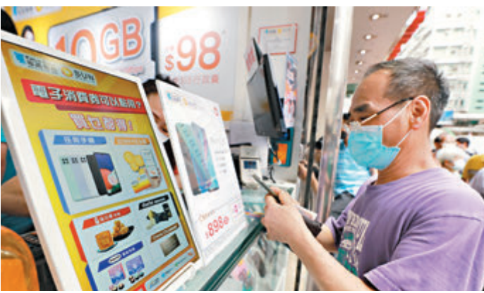
●市民使用消費券繳付電話費。