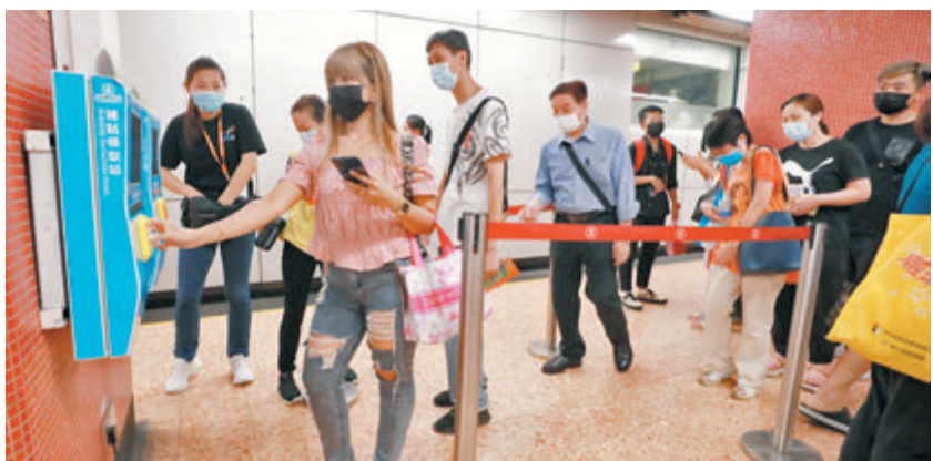
●不少選用八達通的市民昨日前往港鐵站，透過補貼領取站領取消費券。

不過，八達通公司回覆香港文匯報查詢指，根據他們與商戶簽署的協議，商戶只能向顧客收取貨品的實際價錢，如果有商戶不按開戶協議收取手續費等額外費用，八達通有權取消該商戶資格。發言人並補充，公司正核實涉商戶是否在接受八達通付款時有額外收取手續費，如證實有關情況，他們將取消該商戶資格，並提醒所有商戶要遵守開戶協議。