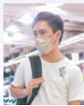
●江先生 香港文匯報記者 攝