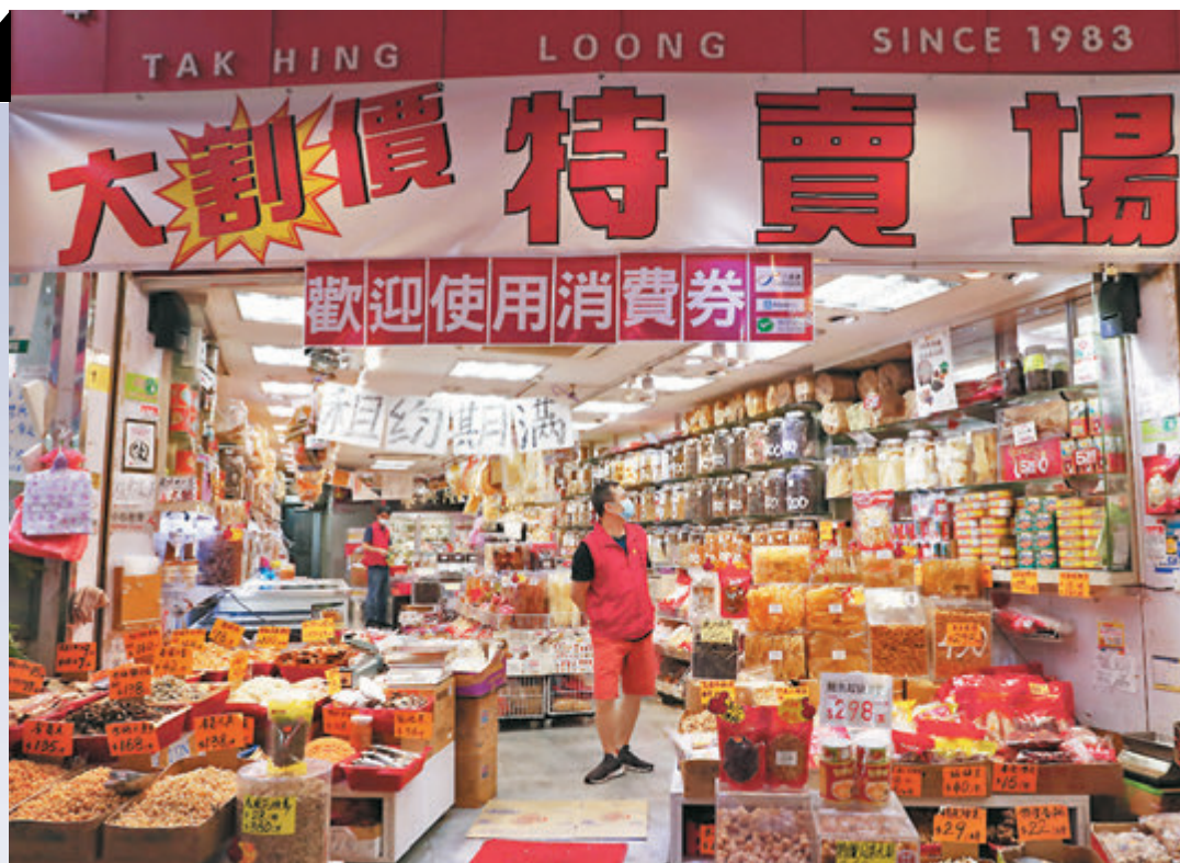
●有商戶大削價，吸引市民使用消費券購物。