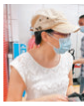
●劉小姐 香港文匯報記者 攝