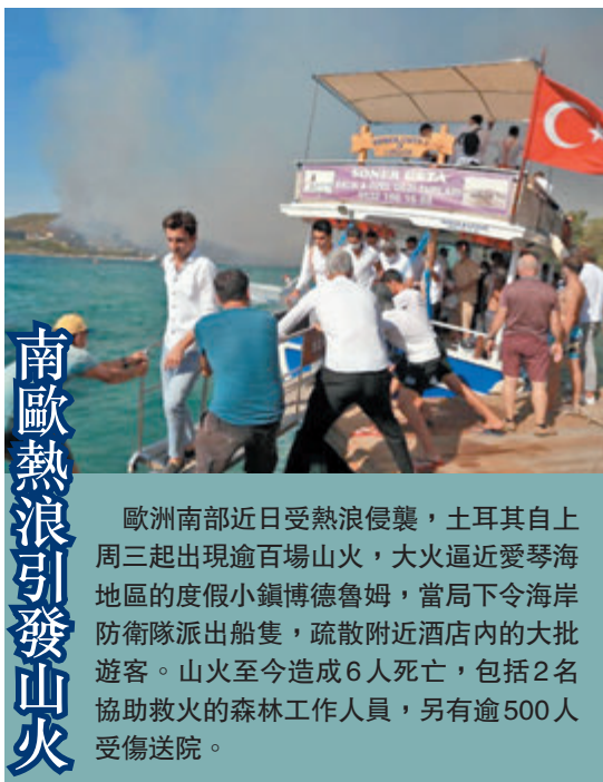
南歐熱浪引發山火

隨着新學年將於本月稍後開始，社會民主黨主席艾斯肯和德國城市協會均促請政府在學校展開接種工作。執政聯盟國會議員弗賴指出，對於尚未合資格接種的兒童，政府應繼續提供免費檢測。 ●綜合報道