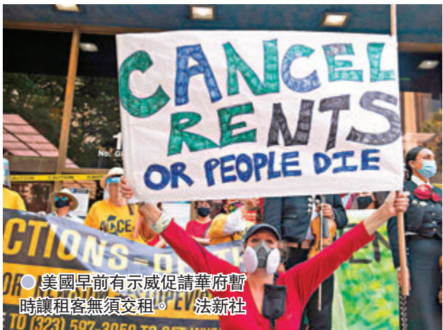
美國早前有示威者請華府暫時讓租客無須交租。

美國去年因應新冠疫情導致大量民眾失業，頒布禁止驅逐租客的命令，讓租戶避免因欠租而遭逼遷。禁令維持11個月後，於昨日凌晨到期，意味數百萬租戶或被逐離住所，以致流離失所。國會由於無法達成共識，未能延長禁令，總統拜登政府亦拒絕採取行動。有民主黨議員在國會山莊外露宿，抗議拜登應對不力，是拜登政府與民主黨罕有地出現分歧。專家憂慮疫情熱點地區不少租戶受影響，恐成為防疫缺口。 驅逐租客禁令由疾病控制及預防中心(CDC)於去年9月頒布，但最高法院今年6月裁定CDC無權自行頒布此類禁令，意味若要延長相關措施，需由國會介入。控制眾議院的