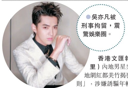
● 吳亦凡被刑事拘留，震驚娛樂圈。