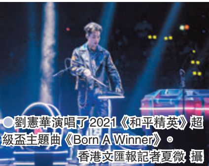
● 劉憲華演唱了2021《和平精英》超級盃主題曲《Born A Winner》。