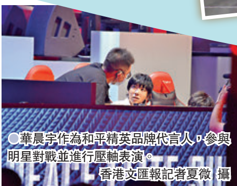
● 華晨宇作為和平精英品牌代言人，參與明星對戰並進行壓軸表演。