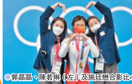
● 郭晶晶、陳若琳 (左) 及施廷懋合影比心。

郭晶晶在水上運動中心，接受傳媒訪問時候透露自己的新工作，主要是給裁判評分，評估裁判工作是否稱職，是否執裁公平。她表示，以前做運動員時覺得自己很專業，現在意識到幕後有很多工作要做，要多聽多學。