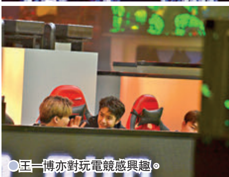
● 王一博亦對玩電競感興趣。

還宣布了LPL與PEL的聯動，「我一直非常關注PEL的發展，PEL作為移動電競領域一種全新的賽事形態所迸發出來的熱情與創造力令我印象深刻。」針對未來的聯動合作，騰訊互動娛樂K6合作部副總經理、騰競體育聯席CEO金亦波表示，LPL與PEL將在俱樂部、選手、解說等領域呈現更多精彩紛呈的合作內容。