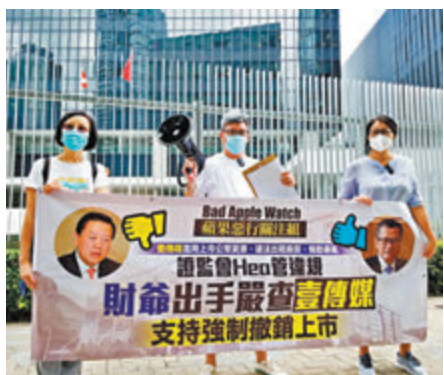
●團體「蘋果惡行關注組」一行3人昨日來到政府總部請願，表示「支持財爺出手、撤銷壹傳媒上市地位」。

香港文匯報訊 (記者 子京) 財政司司長陳茂波日前根據《公司條例》賦予的權力，委任審查員調查壹傳媒公司事務，並在6個月內就涉及壹傳媒的8大事項提交報告。團體「蘋果惡行關注組」一行3人昨日到政府總部，要求證監會撤銷壹傳媒上市地位，不要「Hea管違規」。 團體支持財政司司長出手，徹查壹傳媒涉嫌違法挪用公款作為煽動暴亂資金的行為。他們質疑，壹傳媒涉嫌長期濫用上市公司資源，從事反華反政府的煽動勾當。經警方國安處刑事調查後，部分管理層已被拘捕，理應嚴懲永久除牌、撤銷公司註冊及強制清盤。