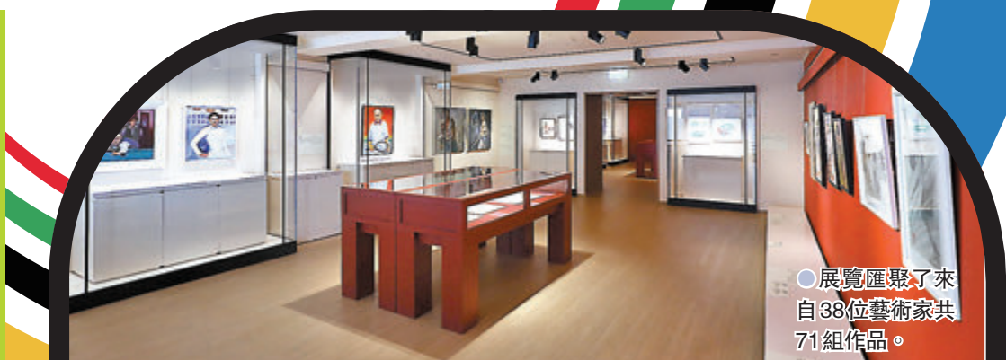
●展覽匯聚了來自38位藝術家共71組作品。

2020東京奧運正如火如荼舉辦，藝術界也響應這一萬眾矚目的盛事，將運動員的颯爽英姿與勵志精神定格於筆下。一新美術館近日推出「一新剛柔：香港藝術家與運動家」展覽，呈現來自38位香港藝術家共71組新作，他們以素描、水墨、油畫、岩彩等諸多媒介，描繪了不同體育項目運動員比賽或訓練時的獨特姿態。在賽事牽動人心的當下，我們不妨亦透過藝術作品，去感受藝術與運動間相通的「剛柔並濟」之妙處。