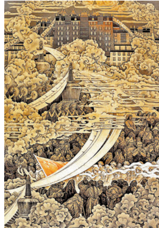
●高原祥雲——和平解放西藏 資料圖片