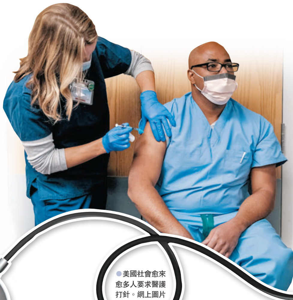
●美國社會愈來愈多人要求醫護打針。網上圖片