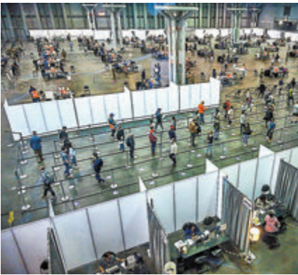
●紐約市一間接種中心有不少人在排隊等候。

大教師工會已表示，支持將州政府的強制接種計劃涵蓋教師，以提高教職員接種率，確保安全回校上課。 ●綜合報道