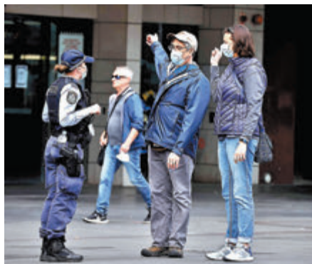
●悉尼警員街頭攔截市民，查問其外出原因。

昆士蘭州副州長邁爾斯指出，短暫封城已未能遏止疫情擴散，期望延長封城可讓當局有更充足時間，追蹤確診者的密切接觸者，並通知他們在家隔離。由於這次爆發與學校有關，多間學校的老師和學生，以及他們的家人需接受隔離。新南威爾士州昨日新增207宗個案，自6月中爆發新一波疫情以來，累計錄得超過3,600宗病例，悉