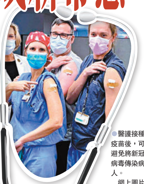
●醫護接種疫苗後，可避免將新冠病毒傳染病人。網上圖片