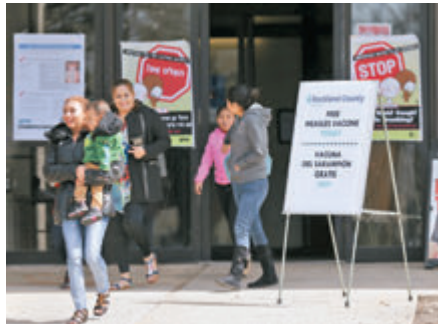
●全美各州均有法例要求學生接種麻疹疫苗。圖為紐約市一間麻疹疫苗接種中心。網上圖片

先例，很難想像沒有強制措施配合，能成功遏止疫情。亦有專家指出，若要阻止新冠疫情蔓延，強制接種疫苗是合理方法，否則病毒擴散將威脅兒童及其他染疫高危人士，亦可能令病毒持續變異，削弱疫苗效力，令防疫工作更困難。 ●綜合報道