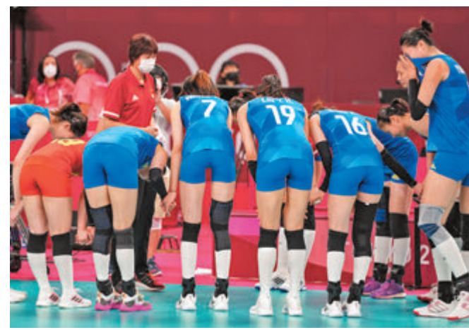
▼8月2日，東京奧運會女排小組賽，中國女排3:0勝阿根廷女排。圖為比賽結束後，隊員向郎平鞠躬。