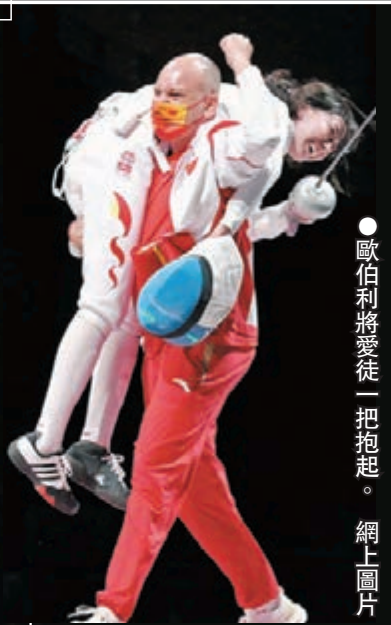
Hugues Obry 前法國擊劍運動員、2004年雅典奧運會男子重劍團體冠軍 現任中國擊劍隊重劍主教練