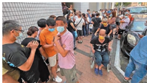
●鍾南山前晚建議澳門盡快開展全民核酸檢測，澳門昨天實施，預計明天完成。

他還透露，自己昨晚已聯繫中國工程院院士鍾南山，一起研究應對措施。鍾南山建議澳門盡快開展全民核酸檢測，對所有隔離人士進行血清檢測，特區政府已展開