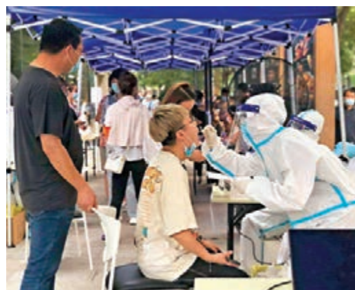
●澳門染疫女生到過的西安小寨街道啟動了全員核酸檢測。

前晚開始，涉及的相關區域即迅速行動進行防控。西安小寨街道立即調人力分工合作，啟動了全員核酸檢測，設立12個採樣點，對轄區內所有