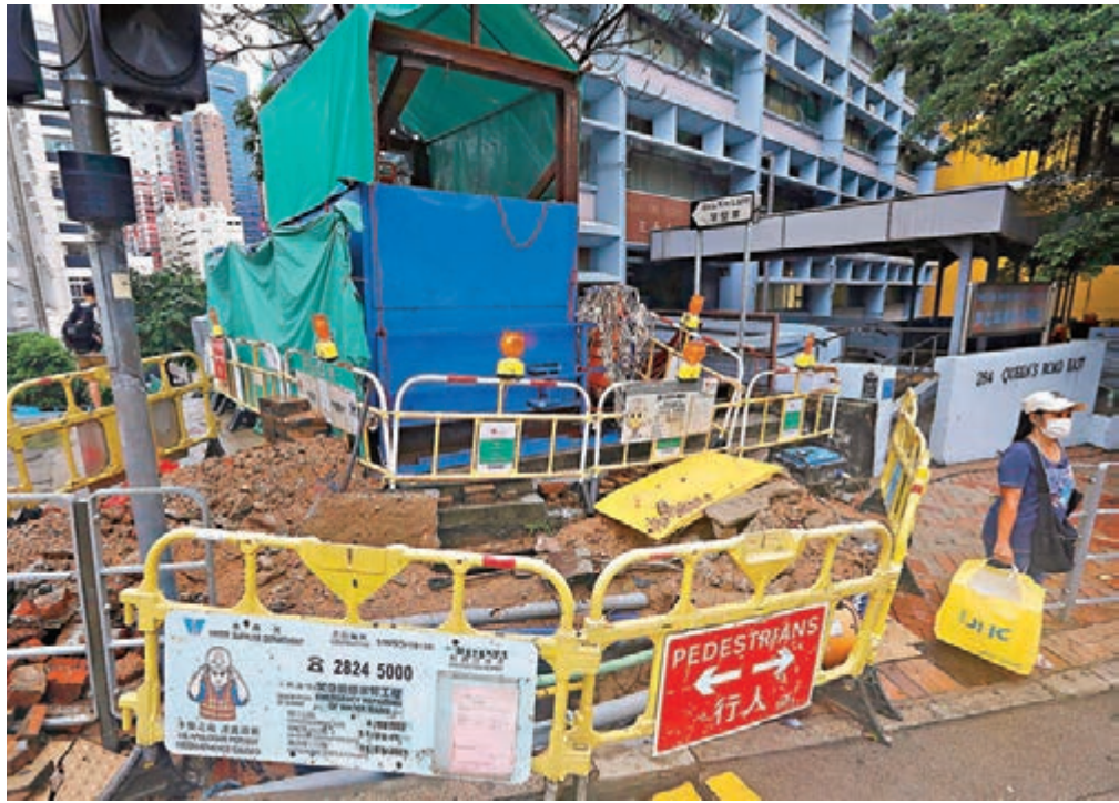
●燒焊工人曾在灣仔肇聖里路邊地盤工作。