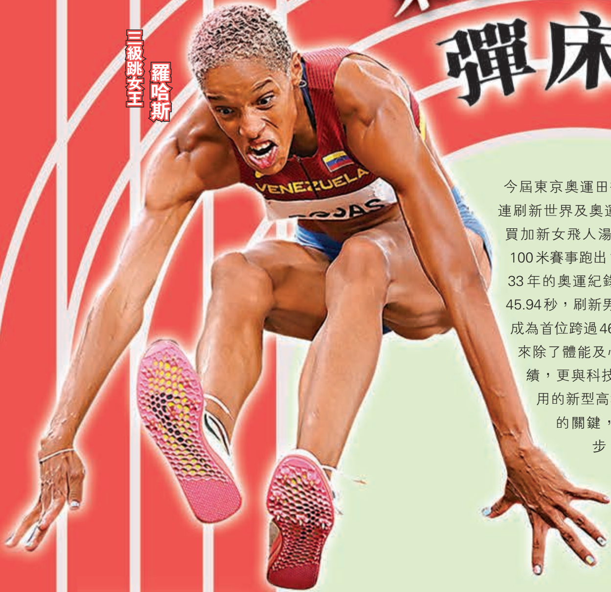
三級跳女王 羅哈斯

今屆東京奧運田徑賽事接連刷新世界及奧運紀錄，例如牙買加新女飛人湯普森-赫拉在女子100米賽事跑出10.61秒成績，打破塵封33年的奧運紀錄，挪威跑手瓦霍爾姆更以45.94秒，刷新男子400米欄賽事的世界紀錄，成為首位跨過46秒大關的400米欄選手。不過原來除了體能及心理狀態因素外，東奧選手連創佳績，更與科技進步有密切關係，尤其是東奧所採用的新型高科技跑道，更被指是運動員跑得更快的關鍵，不少選手也直言在新國立競技場跑步，就如同「跑在空氣上」。