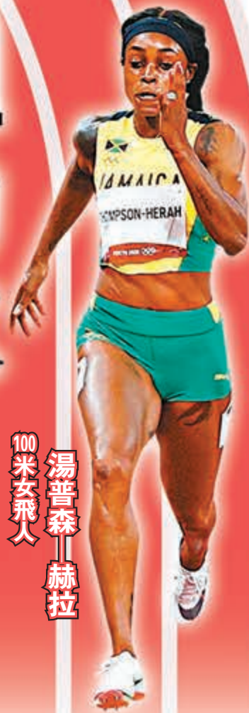
100米女飛人 湯普森-赫拉

東京奧運田徑項目主場館新國立競技場所使用的跑道，是由曾為12屆奧運設計跑道的意大利公司Mondo供應。雖然在一般體育迷大多可能都沒聽過Mondo的名字，不過這個品牌在職業運動員間一直享負盛名，據公司所指，在過往20年間，逾半世界紀錄都是在Mondo的跑道上產生。