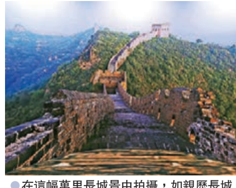
●在這幅萬里長城景中拍攝，如親歷長城一樣。

早前，香港國際旅遊展（ITE）在延遲一年後順利舉行，屆時匯聚來自16個國家及地區一百多家展商，其中境外及海外的佔整體超過50%，如中國內地、香港、澳門、台灣、阿根廷、保加利亞、加拿大（黃刀鎮）、伊朗和西班牙（卡斯蒂利亞-拉曼恰）、日本德島縣、福岡縣、長崎縣、富山縣、熊本縣、宮崎縣等都有自己的展台。雖然旅展規模縮小了，但仍保持質量，例如外地展商仍維持在較高的比例，引入了新主題，展商及特別展示區包括豪華露營、大灣區、特色餐廳、舉辦由KOL及專家主講的講座，還有展商的新推介。