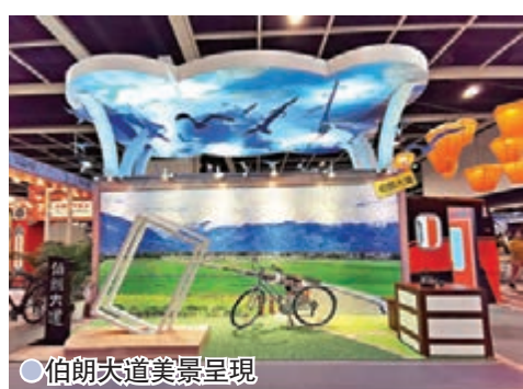
●伯朗大道美景呈現