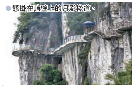
●懸掛在峭壁上的月影棧道。

一位名人在遊覽龍缸後，留下了這樣一首壯美詩篇：棧道凌空萬丈淵，洞映山月臨缸沿/四壁刀削垂藤蘿，滿底林翠峯紫煙/俯首絕崖驚心魄，回眸麗景美山川/前路崎嶇多險阻，無限風光在登攀。