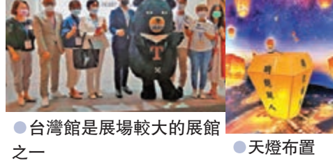
●台灣館是展場較大的展館之一