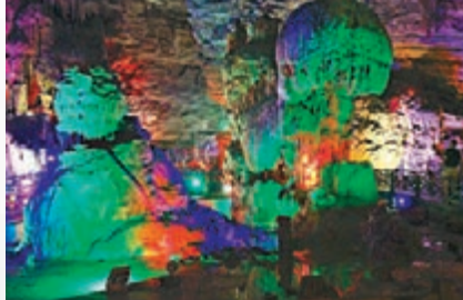
●龍洞內千奇百怪的鐘乳石

遊罷雲端廊橋，乘觀光車沿着盤山公路而下，便來到「龍洞」入口。時值正午，太陽炙烤着大地，雖然身處海拔1,000餘米的山裏，但仍感覺十分炎熱。入洞口，一股涼氣撲面而來，頓時感覺神清氣爽。沿着旋梯一步步往下走，氣溫越來越低，好似一下子進入寒冷的冬季。同行的女遊客抱緊雙臂，冷得直打哆嗦。就在這時，不知是誰大喊了一聲：這麼冷，要是有件羽絨服就好了！