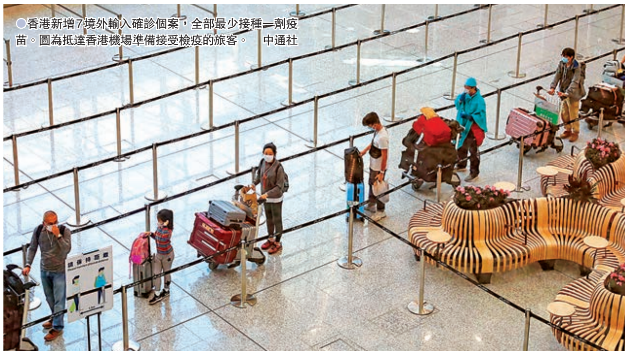
●香港新增7宗外輸入確診個案，全部最少接種一劑疫苗。圖為抵達香港機場準備接受檢疫的旅客。

香港社區疫苗接種中心將延長運作一個月，他希望能進一步推高接種率，並呼籲市民把握機會，盡快打針。