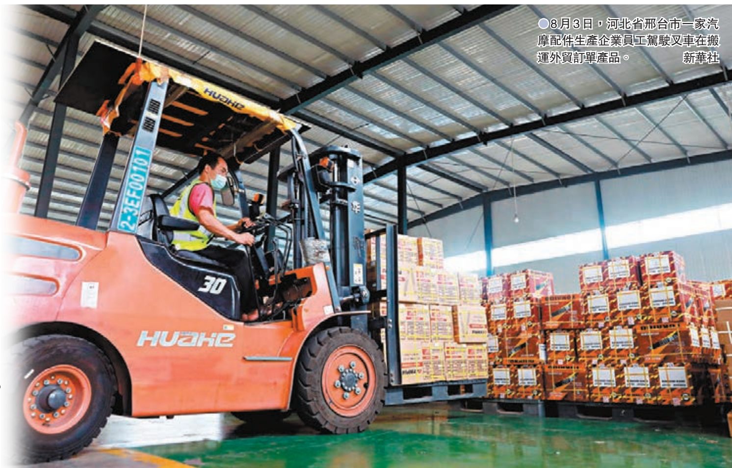
●8月3日，河北省邢台市一家汽摩配件生產企業員工駕駛叉車在搬運外貿訂單產品。

香港文匯報訊（記者 海巖 北京報道）受全球產業鏈修復後訂單回流、基數抬升等因素影響，內地7月出口增速回落。海關總署7日發布數據，以人民幣計，7月內地出口同比增長8.1%，較6月回落12.1個百分點。此外，今年前7個月，外貿進出口總值21.34萬億元人民幣，同比增長24.5%，連續14個月保持正增長。專家指出，下半年內地出口同比增速預計會逐步放緩，但在歐洲、東南亞及「一帶一路」沿線國家需求拉動下，內地出口仍有望保持韌性及較高景氣。