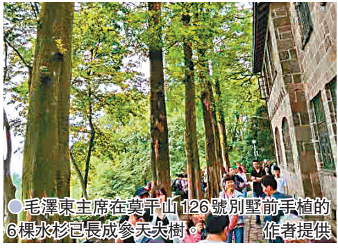
毛澤東主席在莫干山126號別墅前手植的6棵水杉已長成參天大樹。

或許，1984年9月來莫干山出席中青年經濟科學工作者學術討論會的代表們，是有時間去品味蔣介石幣制改革會議舊址的。那是十二屆三中全會開啟以城市為中心的全面經濟體制改革進程前夕，來自全國各地的183名中青年經濟學家，通過論文投稿選拔方式，匯聚於此，縱論中國改革面臨的重大理論和現實問題。這是一次被喻為中青年經濟學家集體發聲的歷史性會議，所取得的成果為十二屆三中全會提供智力支持，從不同方面影響了1980年代