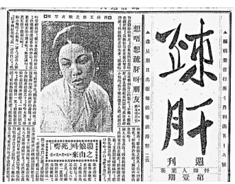
●相中人黑白製作，密密實實，無甚看頭。

徹三更，洋洋乎，欲罷不能。正話結婚之新人讀此聯，回想當夕情形，能無拍案叫絕乎！」