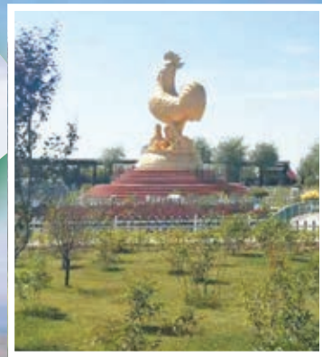
●金雞坪梯田公園中「金雞雄唱」。

說起梯田景觀，很多人會想到分布在雨水豐沛地區的哈尼梯田、龍脊梯田等，而鮮有人知的是，位於黃土高原上寧夏南部山區的金雞坪梯田公園，其起伏的山巒色彩斑斕，層疊的梯田，猶如一幅美麗的山水田園畫卷，近年愈來愈多的遊客慕名而來，賞梯田觀美景，梯田建設已成為彭陽生態建設一張靚麗的名片。