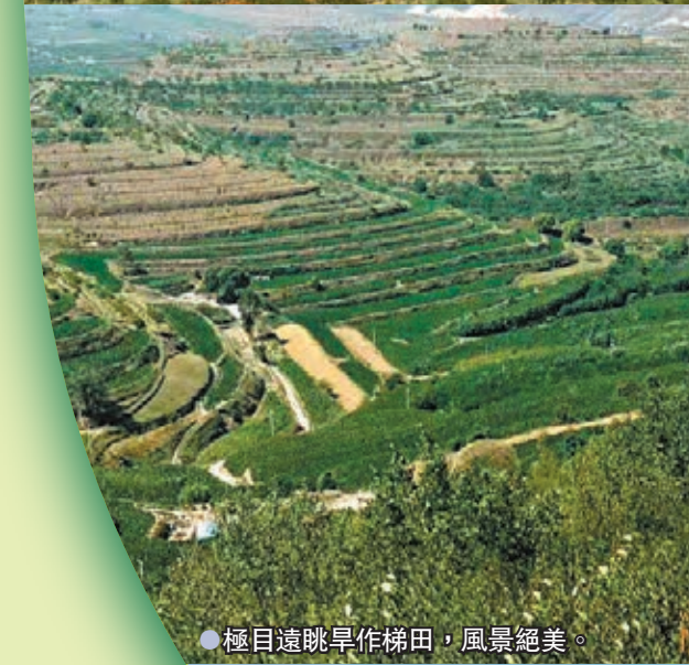
●極目遠眺旱作梯田，風景絕美。

冠花和紅豆草），種植「一枝花」（格桑花）1000畝。在金雞坪旱作梯田公園內部道路兩側2至3公里範圍內的荒山、林地、梯埂以桃、杏密植，村旁、宅旁、路旁進行綠化美化，改造提升林地面積6765.8畝。