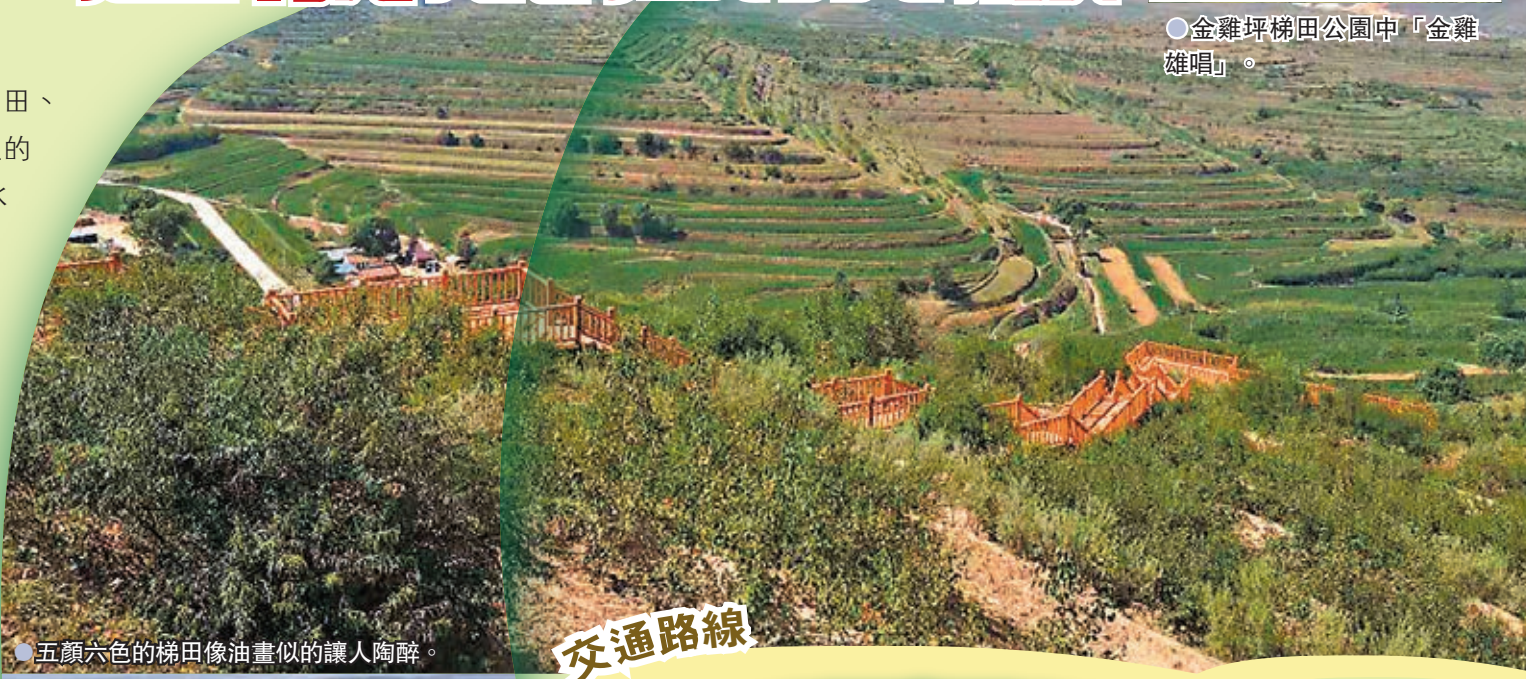
●五顏六色的梯田像油畫似的讓人陶醉。