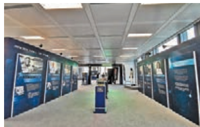
●同場展出價值百萬的傳奇賽車手簽名頭盔和賽車服系列。

最後，第三階段「開跑吧！」在這裏，小朋友的努力將得到回報，無論在控制室、進站還是在賽道上，他們都可以第一身感受方程式賽車中所有令人興奮的時刻。為了讓賽車手真確體驗賽車帶來的快感，這兒在賽車模擬體驗中加入先進的FPV技術（第一身視角），車手佩戴FPV眼鏡，利用實際大小的賽車軀殼控制模型賽車，以第一身視角穿梭於香港的蜿蜒街道，爭奪冠軍。同時，這個模擬器亦適合成人體驗，父母和孩子可一同參與，在激烈比賽中加強親子間的聯繫。如欲知體驗館通行證的詳情，可於 https://www.yumme.com.hk 查詢。 ●採、攝：雨文