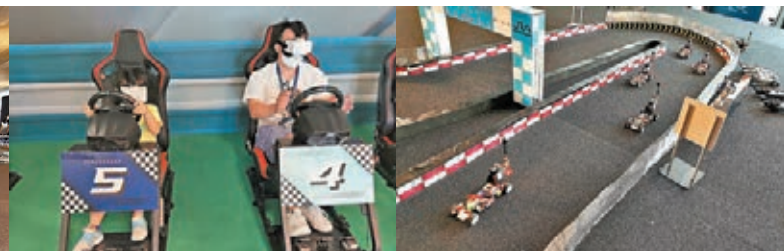
●FPV模型賽車體驗，車手模擬賽車於賽道行駛。

本版「趣遊香港」欄目，藉以尋覓香港有特色及鮮為人知的秘景，歡迎來稿跟讀者分享，需圖文兼備，並附圖說，字數以800至1,000字為宜，圖片5張以上，請勿一稿多投。如獲刊登，將致薄酬。投稿信箱：feature@wenweipo.com或wvpfeature@yahoo.com.hk