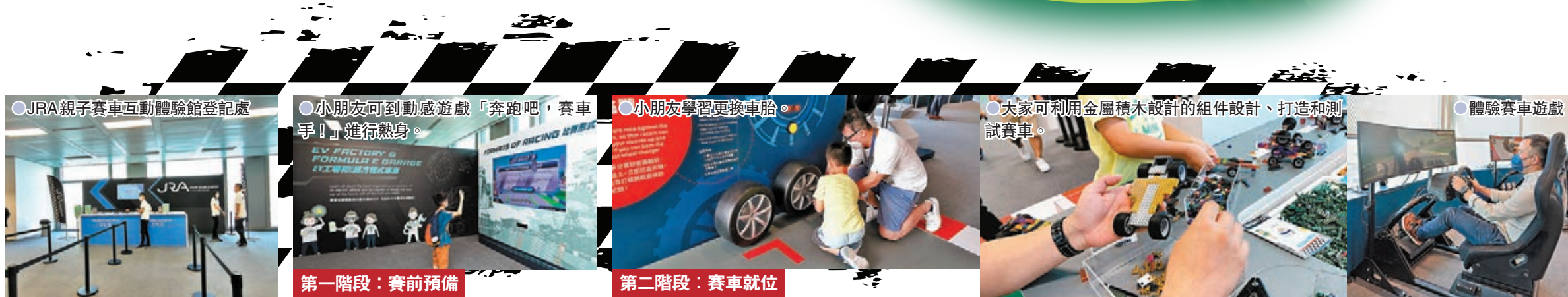
●JRA親子賽車互動體驗館登記處