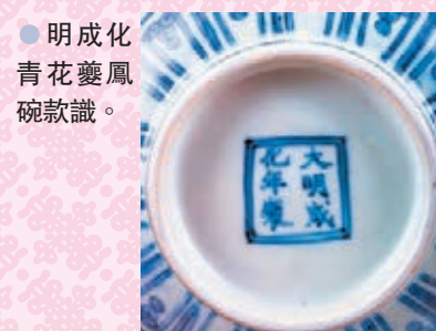
● 明成化青花夔鳳碗款識。