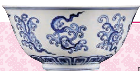
● 明成化青花夔鳳碗。