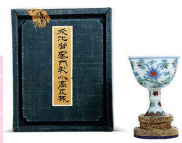
● 明成化門彩花卉紋高足杯。

成化時期是瓷器發展的鼎盛時期，在收藏界流傳着這樣一句說話：「寧存成窯，不苟富貴。」成化時期的官窯產品質量極其講究，民窯亦不乏精美的出品，其中兩個最具代表性的品種，一個是青花，一個是門彩：前者被推為明代八大時期之冠，玲瓏秀奇、端巧工細，其胎潔白細膩、釉瑩潤如脂，色彩柔和、筆畫流暢；後者被視為成化瓷器最重要的成就，胎薄體輕、釉脂瑩潤、色彩鮮艷，畫面通常清雅雋