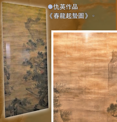
● 仇英作品《春龍起蟄圖》。

此畫作展現了一種動感，「蟄」指二十四節氣中其中一個季節，作者當時就描繪了春回大地、萬物甦醒的狀況。畫中右下角見僕人舉起手下意識地擋風，而上一層的主人則泰然自若地感受遠道而來的風，亦見江面波濤洶湧。值得關注的是，細看畫中左邊的位置，有一條若隱若現的龍。