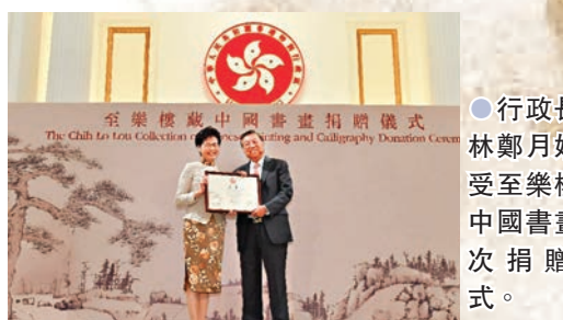
● 行政長官林鄭月娥接受至樂樓藏中國書畫首次捐贈儀式。