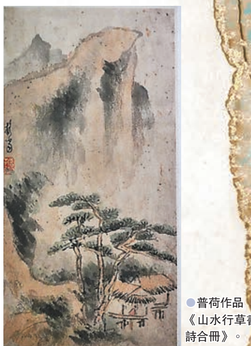
● 普荷作品《山水行草書詩合冊》。