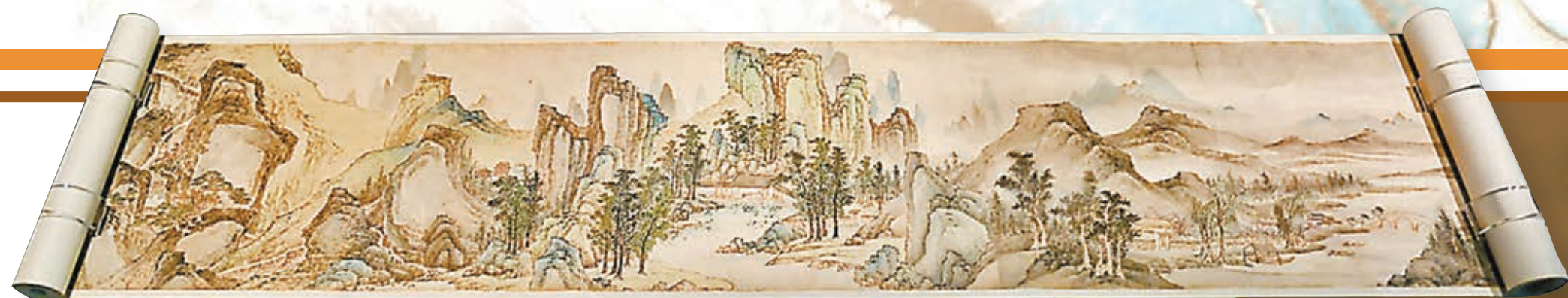
● 本次捐贈的高簡手卷作品《江山不盡圖》。