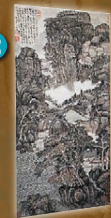
● 髡殘作品《雨花木末圖》。

該作展現靜態的景象，江面風平浪靜。中國畫善於將水的形態畫得出神入化，因此，有別於《春龍起蟄圖》，髡殘用了截然不同的手法去表現水的狀態。江上見一個釣魚翁坐在一葉小舟上釣魚，讓人感受到一種休閒的心境和態度。