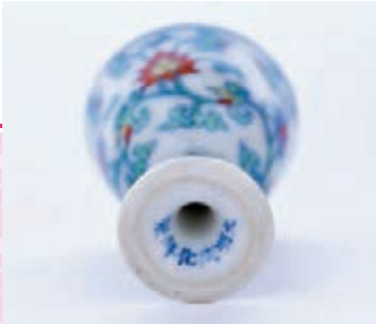
● 明成化門彩花卉紋高足杯款識。

明憲宗登基之後，頗有明君作派，為冤案昭雪，讓因冤案被貶謫的大臣官復原職、體諒民情、勵精圖治，朝政有振興的氣象。然而，好景不長，憲宗漸漸沉迷於修仙長壽之道，縱情聲色，且因他極其寵愛的萬貴妃喜愛瓷器玩物等「奇巧之物」，為討紅顏歡心，憲宗傾全國之力燒製精美、高質的瓷器。