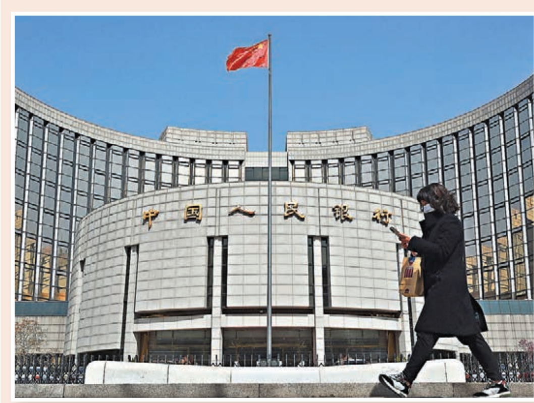
●7月社會融資規模增量為1.06萬億元（人民幣，下同），低於市場預期的1.6萬億元，更是在近一年半內首次出現社融增量低於信貸增量的情況。

展望下一步貨幣政策，梁斯指出，貨幣政策將堅持穩健基調。當前經濟運行整體穩定，但仍存在恢復不平衡、不均衡的問題，近期疫情反覆對經濟穩健運行產生影響，貨幣政策需要多措並舉為實體經濟提供充足的融資支持，緩解疫情衝擊。與此同時，雖然今年以來宏觀槓桿率穩中趨降，但仍保持較高水平，出於風險防範的目的，貨幣政策不具備大幅放鬆的可能。加之全球疫情存在較大變數，美聯儲貨幣政策提前轉向預期升溫，未來貨幣政策將在穩健的基調之上更加注重調控的靈活性、合理性，平衡好內部和外部、長期和短期之間的關係，更好在穩增長和防範風險之間建立平衡。