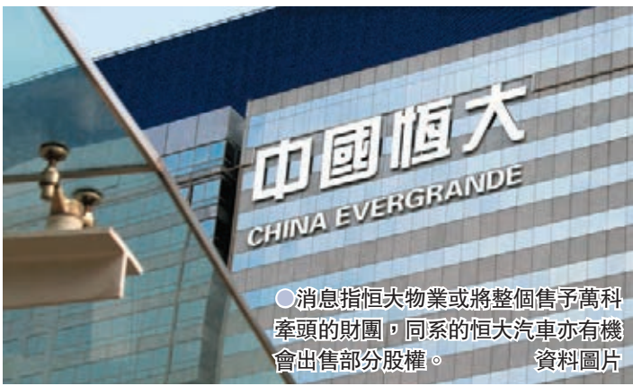
●消息指恒大物業或將整個售予萬科牽頭的財團，同系的恒大汽車亦有機會出售部分股權。 資料圖片

香港文匯報訊（記者 周曉菁）恒大（3333.HK）債務危機傳出喜訊，旗下恒大物業（6666.HK）或將整個售予萬科（2202.HK）牽頭的財團，同系恒大汽車（0708.HK）亦有機會出售部分股權。財