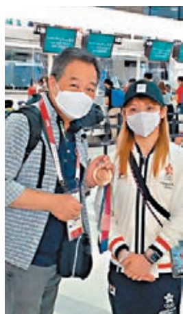
●與奧運空手道銅牌劉慕裳合照。