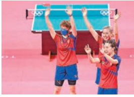
●在東京奧運，港隊女子乒乓球團體賽奪得銅牌。