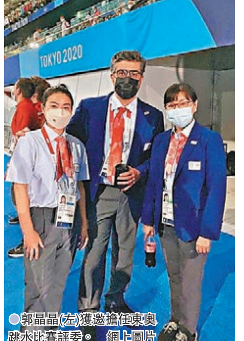
●郭晶晶(左)獲邀擔任東京奧運跳水比賽評委。