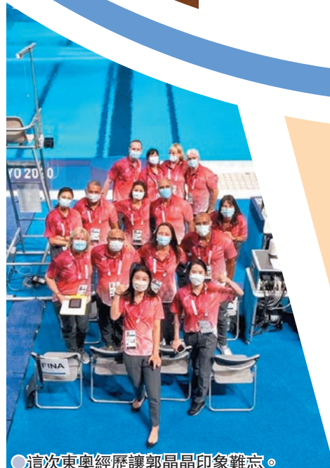
●這次東京奧運經歷讓郭晶晶印象難忘。

香港文匯報訊(記者阿祖)「跳水皇后」郭晶晶之前獲邀擔任東京奧運會跳水比賽評委,而隨着東京奧運圓滿結束,郭晶晶也於社交平台發表了以不同身份參與奧運的感受。 郭晶晶說:「對我來說是一種新的挑戰,這次作為TDC(國際泳聯跳水技術委員會)成員參加,才發現,呈現在觀眾前的每一場精彩比賽,除了我們能看到的運動員們的拚搏和全力以赴,在我們看不到的背後,撐起整場比賽的,還有許許多多奧運相關工作人員和志願者們的不懈努力。」 郭晶晶回想以前自己參加比賽,心裏會有壓力會緊張;而這次在場邊看其他運動員比賽,心裏會有感嘆、敬佩、興奮,也偶爾會有遺憾:「重回泳池邊,勾起了我非常多的回憶,很感謝周領隊把我帶到TDC,讓我可以繼續參與到這項陪伴了我整個青春的運動項目裏來,從不一樣的角去體驗奧運,使我獲益良多。也感謝有她為跳水夢之隊保駕護航,再創佳績。」郭晶晶希望有機會在往後的每一屆奧運會,都能陪伴在奧運健兒們的身邊,一起把「相互理解、友誼、長久、團結一致和公平競爭」的奧林匹克精神延續下去! ●郭晶晶跟國家隊運動員熱情擊掌。