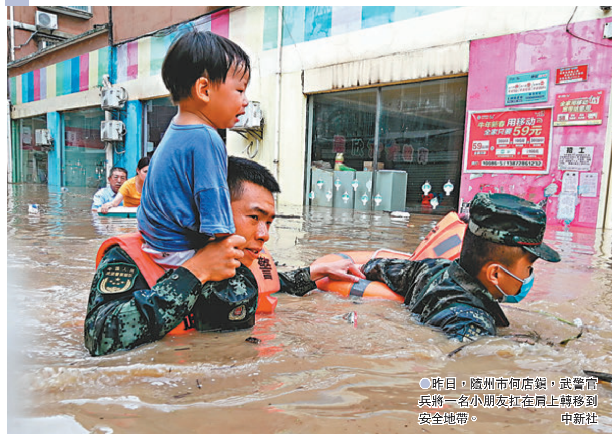
●昨日,隨州市何店鎮,武警官兵將一名小朋友扛在肩上轉移到安全地帶。

在災情較為嚴重的隨州市,該市從8月11日8時到12日8時有10個鄉鎮雨量超過100毫米,多個鄉鎮嚴重受災,其中柳林鎮鎮區積水2.46米,院子河小集鎮積水2米。隨州市大範圍發生較大洪水,一般小型水庫出現險情。目前,當地政府、消防、武警等力量正在全力搶險救災。