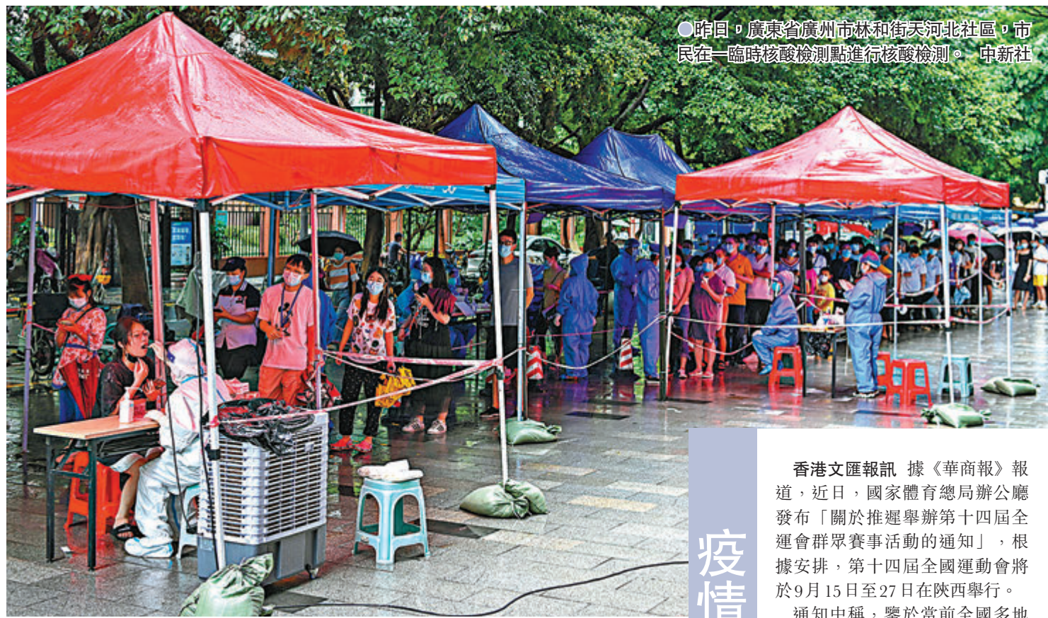
●昨日,廣東省廣州市林和街天河北社區,市民在一臨時核酸檢測點進行核酸檢測。

截至目前,廣州此輪疫情的「零號感染者」(被感染的第一人)仍然不明,首位確診的阿婆被感染的時間和地點也仍不明。