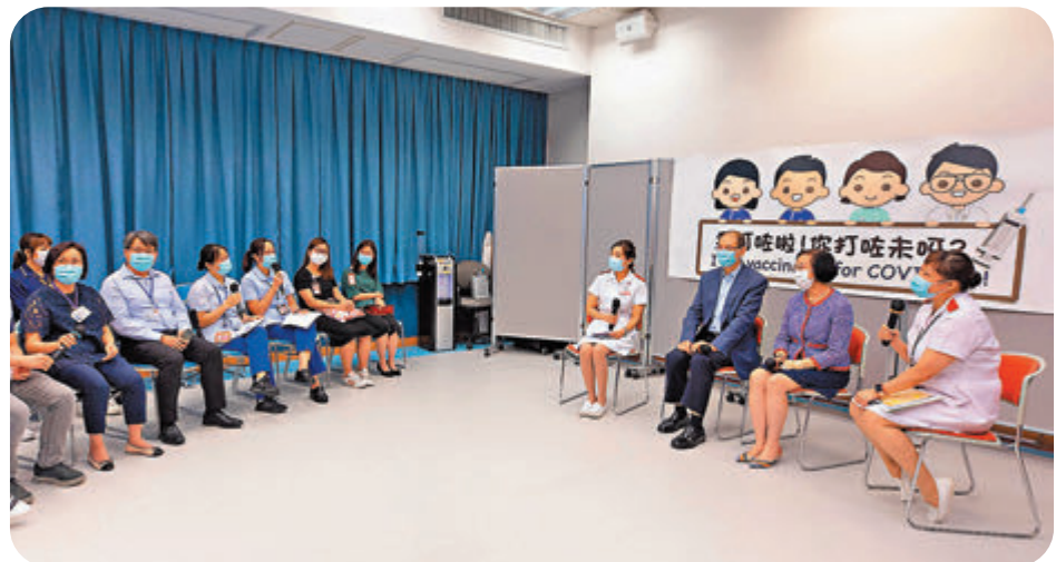
●陳肇始出席由九龍中醫院聯網舉辦的員工網上分享會「我們一家與COVID-19搏鬥的日子」，鼓勵前線醫護人員盡早接種疫苗。