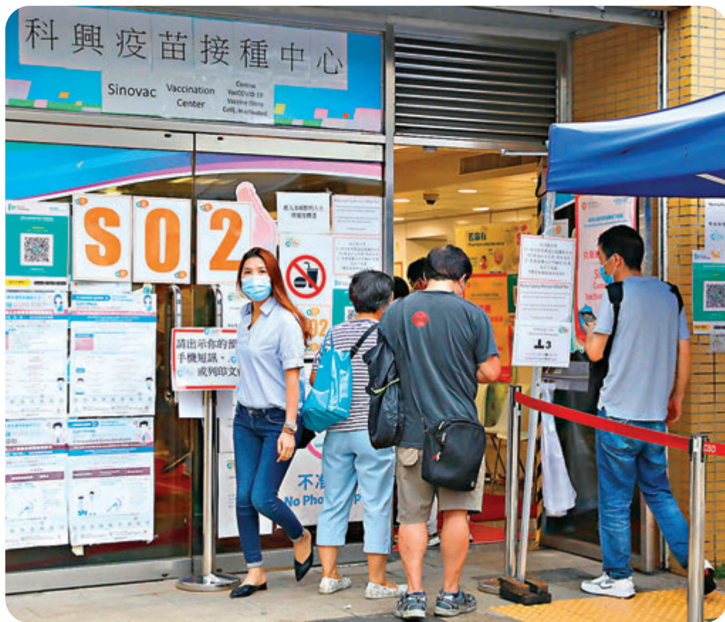
●有專家指，部分人完成接種兩劑科興疫苗後抗體稍遜，認為特區政府確實有需要研究為市民打第三針疫苗以加強保護。圖為九龍灣體育館科興站。

B類食肆的員工如果未打針，必須每7天檢測一次，已完成接種疫苗的員工則毋須定期檢測。倘若香港爆發第五波疫情，政府或需要收緊堂食限制，屆時很可能只容許員工已打齊針的D類食肆，提供晚市堂食。發言人呼籲A、B或C類餐飲業務負責人未雨綢繆，盡力鼓勵全體員工接種疫苗，讓處所有條件時改為D類食肆。