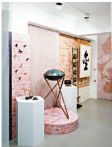
▲飄雅活藝的室內空間。