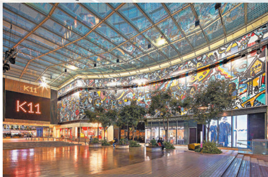
▲獲得「我最喜愛的香港室內空間」之一的K11 人文購物藝術館。