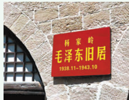
●楊家嶺是中共中央領導當年的住處與中央七大會址。