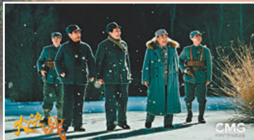
《大決戰》劇中的人物塑造精準地融在歷史情境中。