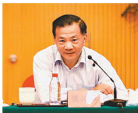
中宣部副部長、中央廣播電視總台台長兼總編輯慎海雄。