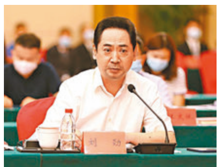
電視劇《大決戰》主演劉勁。

電視劇《大決戰》由中央廣播電視總台出品、總台影視紀錄片中心製作、八一電影製片廠聯合攝製。自6月25日起在中央廣播電視總台央視綜合頻道和央視網、央視網等新媒體平台同步播出。該劇以1945年8月抗戰勝利到1949年10月新中國成立這一歷史時期為背景，全景展現了遼瀋、淮海、平津三大戰役的輝煌歷史，與此同時，「司令部視角」與「戰壕視角」平行展開；「軍事視角」與「社會視角」交相輝映，從政治、經濟、社會、外交、民生等多個層面來精寫解放戰爭，深刻詮釋了「沒有共產黨，就沒有新中國」、「江山就是人民，人民就是江山」的真諦。