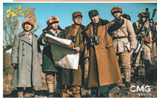
電視劇創作中的人民史觀和戰爭史觀均得到了藝術凸顯。