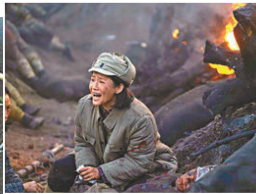
《大決戰》從多個層面描寫解放戰爭。