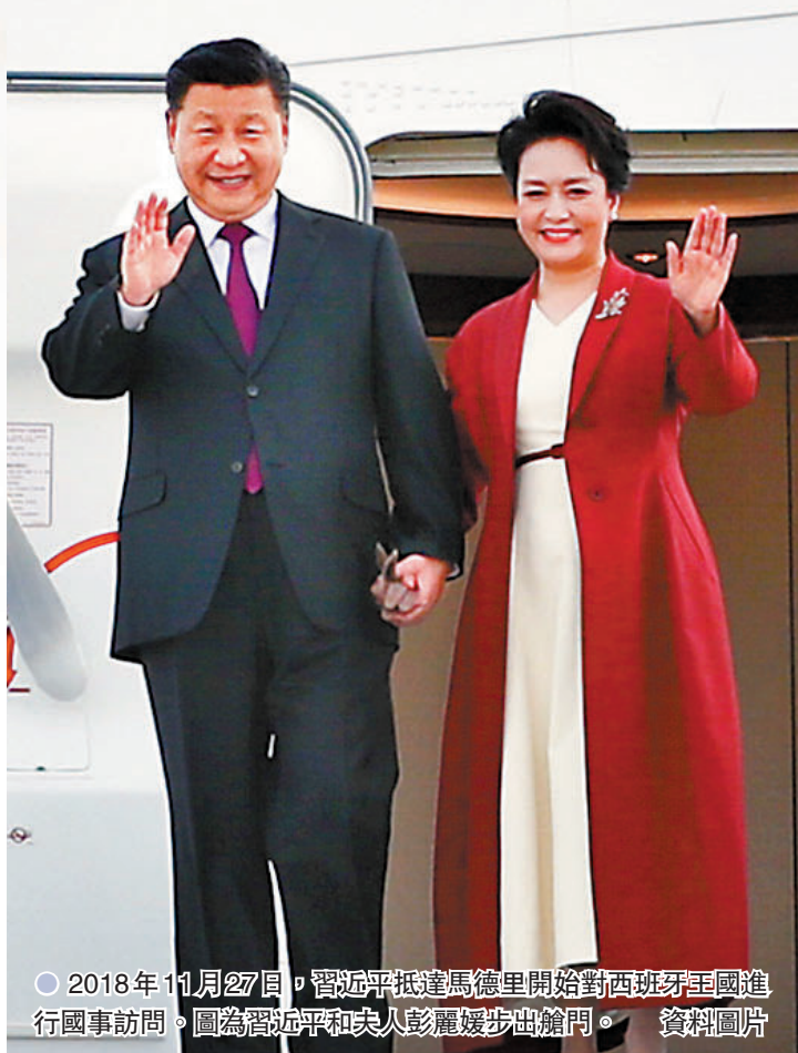
●2018年11月27日，習近平抵達馬德里開始對西班牙王國進行國事訪問。圖為習近平和夫人彭麗媛步出館門。資料圖片