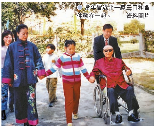
●當年習近平一家三口和習仲勛在一起。資料圖片

婚後，習近平和彭麗媛各有事業，經常不能在一起，但都一直相互理解、相互支持，盡最大努力去關心照顧好對方。彭麗媛說習近平是「稱職的丈夫」「稱職的父親」，彼此也非常關心體貼。2004年8月14日，時任浙江省委書記的習近平接受延安電視台《我是延安人》專訪時談到了自己的家庭生活：「我有一個很幸福的家庭，夫妻倆都有自己的事業，但是對家庭都是共同去建設這個家庭。」他還說：「我每天要給我愛人打一個電話。」