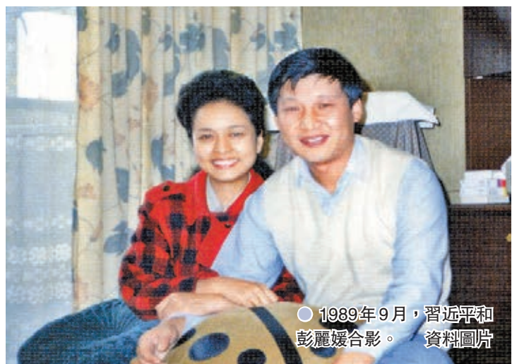
●1989年9月，習近平和彭麗媛合影。資料圖片