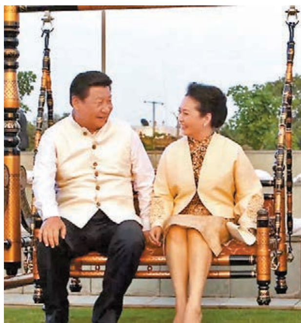
●2014年9月，在印度古吉拉特邦，習近平彭麗媛夫婦親密盪鞦韆。

在澳洲，習近平視察「雪龍」號南極科考船，登上一處較高的船艙時，他不忘回過頭來向彭麗媛伸出手：「來！」在印度，彭麗媛應印方之邀坐到鞦韆上，她試着盪了幾下，便拍拍身邊的空座，習近平很快坐上來，兩人肩並肩盪起鞦韆；在哥斯達黎加走訪一戶農家，面對主人端來的點心，習近平很自然地拿起一塊，表示「我們倆吃一塊就行」，說着把點心遞到彭麗媛面前，讓她掰去一半……種種細微之處，流露出夫妻同心、彼此照顧的真情實感。