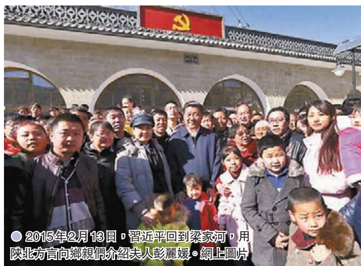
●2015年2月13日，習近平回到梁家河，用陝北方言向鄉親們介紹夫人彭麗媛。